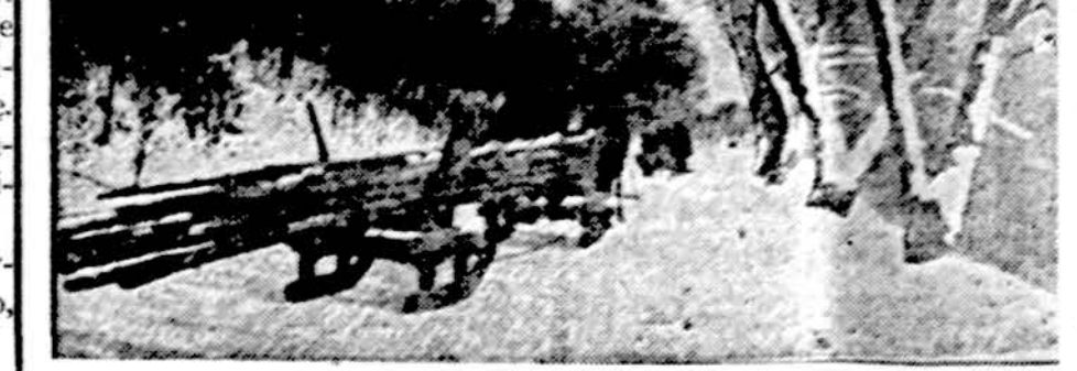
Rastų vežimas žiemos keliu Lietuvoje (Prieškarinė nuotrauka)

Paryžius. — Pirmadienį žadama atnaujinti Amerikos ir Vietnamo pasitarimus Paryžiuje. Vietnamas nori užmegsti diplomatinis ir ekonominius ryšius, žinoma, prašyti ir pinigų.