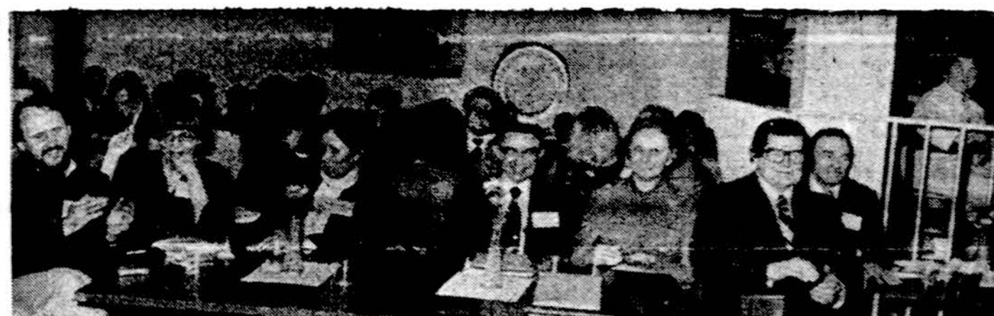
Mokslo ir kūrybos simpoziumą prisimenant. Nuotraukoje matyti svečiai susipažinimo vakarieneje, besiklausą rašyt. Aloyzo Barono kūrybos

STASE'S FASHIONS Kūdikams ir vaikams rūbų krautuvė. 6237 S. Kedzie Ave. Tel. 436-4184 Sav. Stasė Bacevičienė