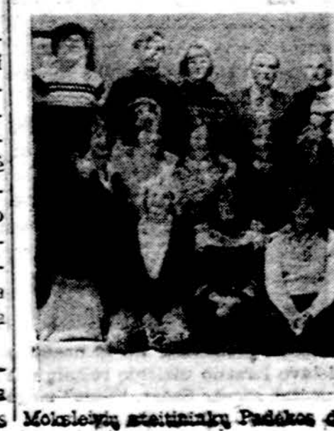
Moksleivių ateitininkų Padėkos dienos kursų dalyviai Dainavoje