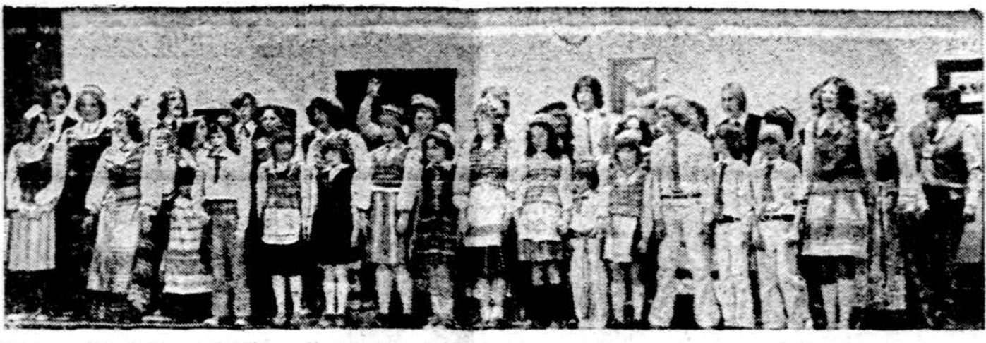
Chicago Mokslo ir pramonės muziejuje lietuvių pasi rodymas