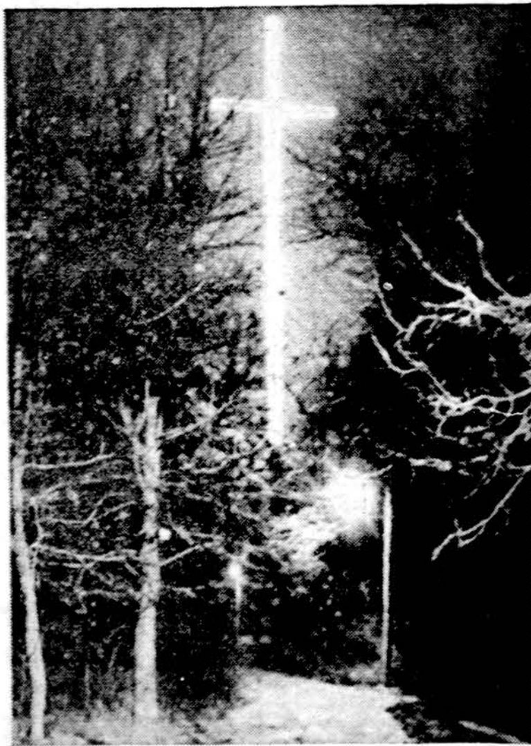
150 metrų aukščio elektros lempučių kryžius Kalėdų laikotarpyje nepriklausomybės laikais būdavo įrengiamas Kaune, radijo stiebuose

HAMILTON. Bermuda. — Bermudos turizmo organizacija skundžiasi, kad smarkiai sumažėjo turistų skaičius, ir jų viešbučiai bankrutuoja. Prie to daug prisidėjo vietinių gyventojų riaušės dėl dviejų juodųjų pakorimo.