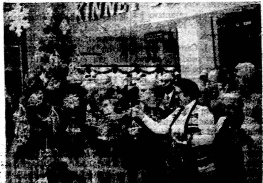
Clevelande Euclid apsipirkimo centre Zalgirio kp. šauliai papuošė lietuvišką kalėdinę eglutę. Matyti Mikulskienė, Čiuprinskienė, Ječmantienė ir kt.

Tomis dienomis bus daug svečių: vyskupų, kunigų, Tikėtina, kad daug suvažiuos ir lietuviškos visuomenės iš plačios apylinkės ir toliau. Juk ne tik parapijai, bet ir visiems lietuviams — didelis džiaugsmas sulaukti lietuvių kunigo, ypač šiais pasimėtimu ir netikrumo laikais. Turime dėkoti Dievui už tokią didelę šventę ir susirinkus melsti Visagalį naujų pašaukimų.