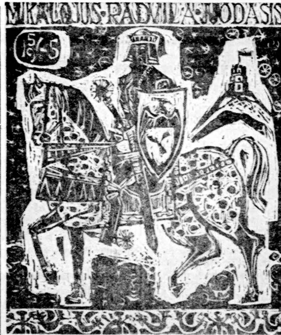
Vytautas Ignas Mikalojus Radvila Juodasis (medžio raizynas)

Biografija, atrodo, ilgų metų darbas. Autorius rašė ją, plačiai