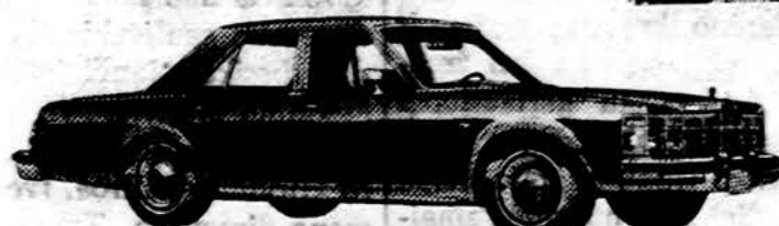
Le Baron Medallion 4-Door Sedan

Turime jaunmoliams mašinas: Cadillac, Buick, Pontiac, Oldsmobile ir kitų, taipgi importuotų, įvairių kainų. Pradedant nuo $100. Mūsų dirbtuvėse prilygę mechnikai pataisyms karoseriją (Body), sparnus (Fenders) ir sureguliuos motorą