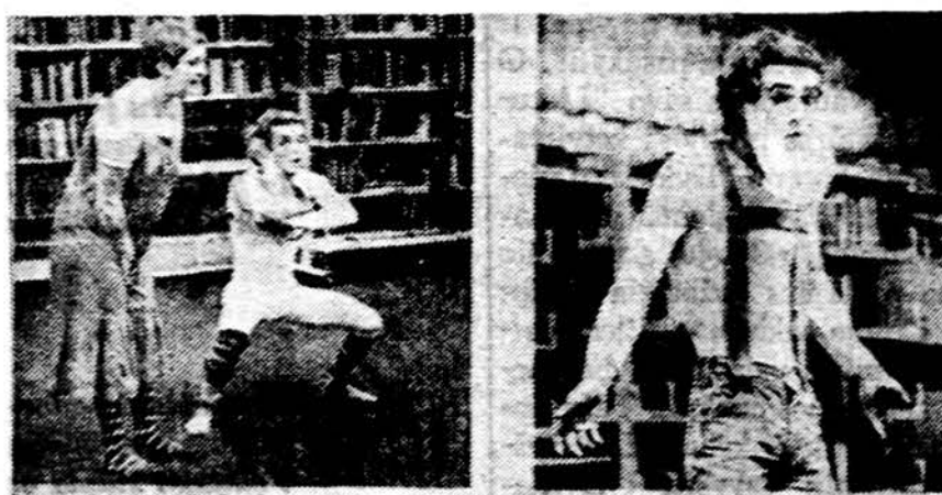
„Sovjetmyndigheter fruktar Konstnärer som talar om frihet“