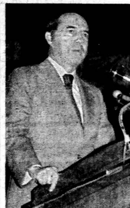
Senatorius Robert Dole pasakė pagrindinę kalbą ir nuosirdžiai sveikina lietuvius Lietuvos nepriklausomybės šventės minėjimo metu, Chicagoje

Taigi daugiau kaip 100 branduolinės energijos mokslininkų, techniku, karių ir įvairių priemonių buvo išsiųsta į 15,000 kvadratinį mylių plotus Š. Kanadoje surasti kenksmingus Sovietų satelito likučius. Kaip ilgai laisvasis pasaulis galės gyventi grėsmėje, kuri skrenda virš mūsų galvų ir nežinia nei kur, nei kada gali atnešti daugeliui nelauktą tragediją?