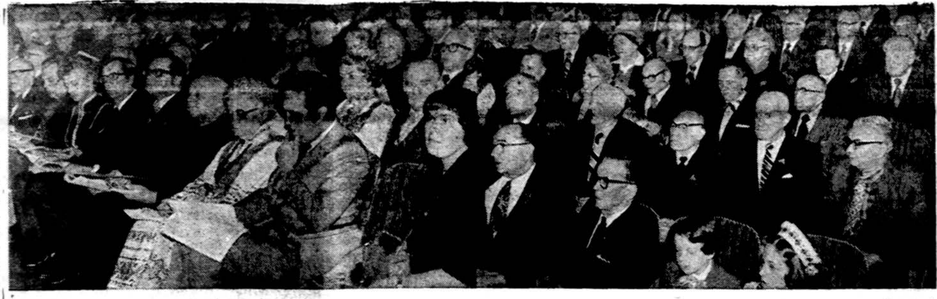
Svečiai Vasario 16-sios minėjime Chicagoje vasario 12 d.