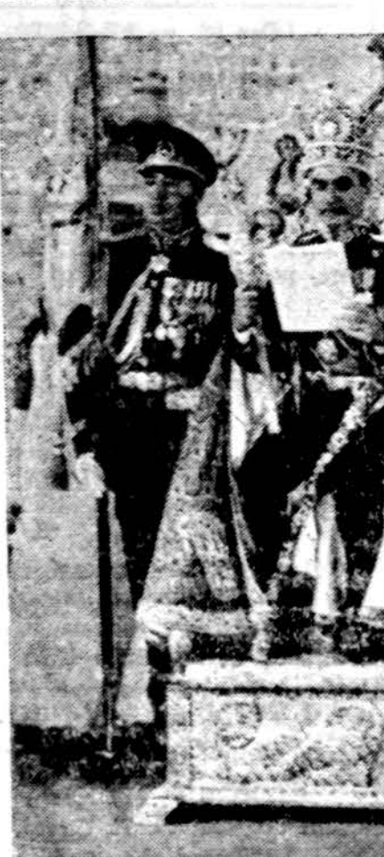
Irano šachas Reza Pahlevi visoj savo didybėj

Washingtonas. — Greitkelių tinklas, pradėtas tiesti 1956, dar nebaigtas, bet keliai jau tiek nusidėvėję, kad reikalingi kapitalinio remonto, ir jų atnaujinimas iki 1995 metų kainuos 19 milijonų dolerių. Iš 33,000 mylių kelio 8 tūkstančiai jau reikalingi naujos dangos. Labiausiai kelius gadiną sunkvežimiai.