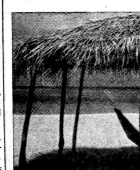
Tikros atostogos. Bora Bora saloj, Pietiniam Pacifikje

Pernai tam aerodrome įvyko didžiausia aviacijos istorijoje nelaimė, buvo beveik 600 žmonių.