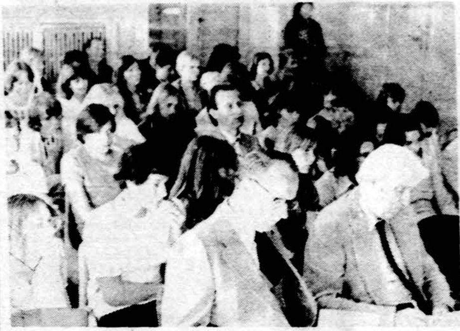
Dalis Vasario 16 gimnazijos mokinių 1979-80 mokslo metų atidarymo progą gimnazijos salėje.