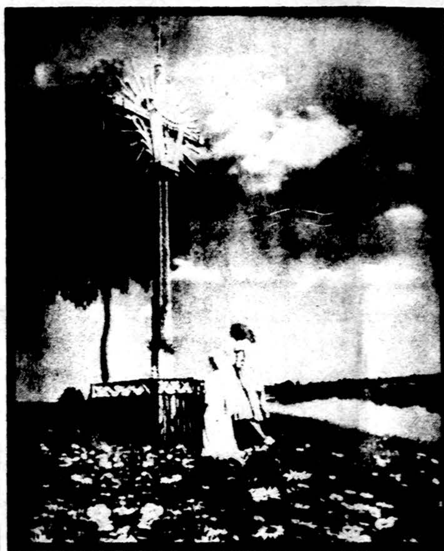
Šiandien Vėlinių diena