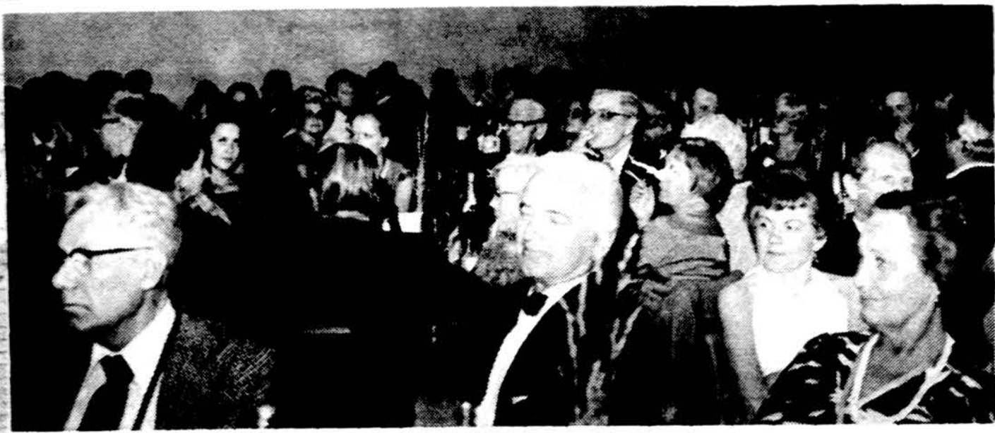
Dalis svečių Clevelando Tėvynės Garsų 30 m. sukakties minėjime Lietuvių salėje.