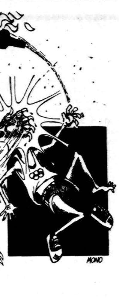
Sovietinė meška treniruoja prieš olimpiadą. Taip ją vaizduoja respublikų biuletenis.

Kai saulėlė į aukščiausią įkrodama skliautą, Saukia čion juos, Erelio virtuvėje maitinamą tautą, Čiauška tarška nameliai gelsvieji ant marių krantelio, Kur senjorai suėję kermošišką klegesį kelia.