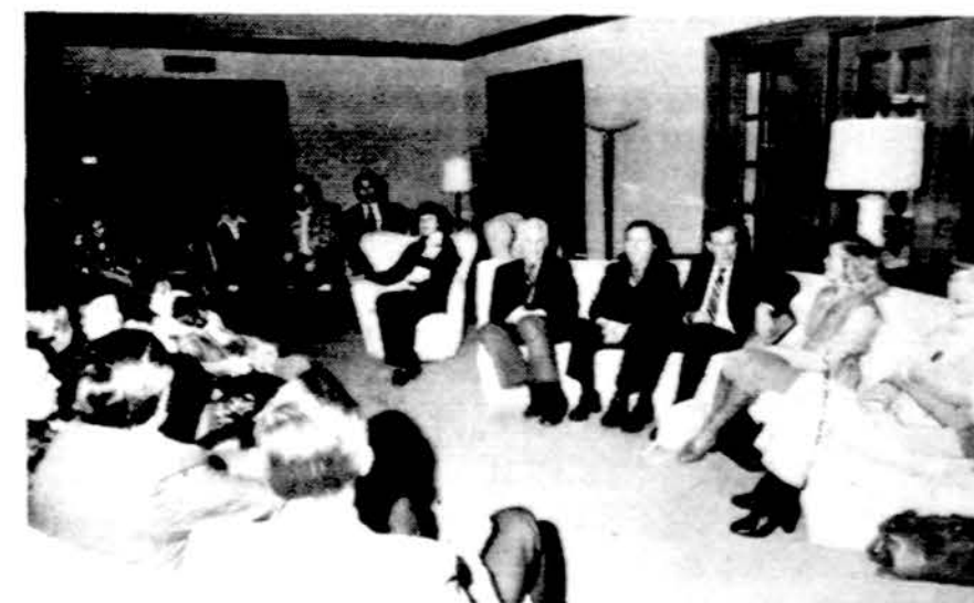
Cicero ateitininkų tėvai Ateitininkų namų Lemonte salione.

Praėjo šeštadienio straipsnyje Vasario 16-ji ir ateitininkija vasario 16-ios signataro vardas turi būti Jonas Vailokaitis.