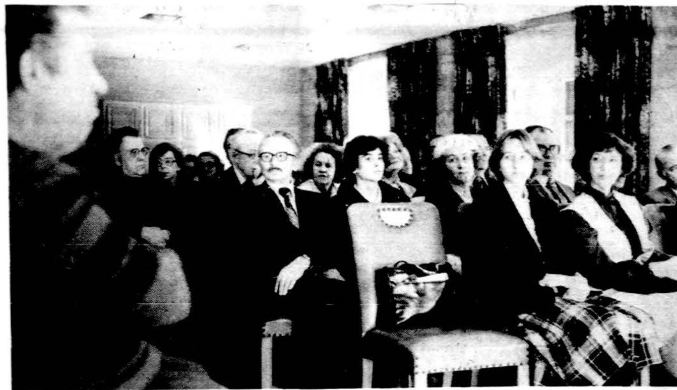
Ateitininkų namuose svečiai klausosi Kazio Bradūno poezijos.