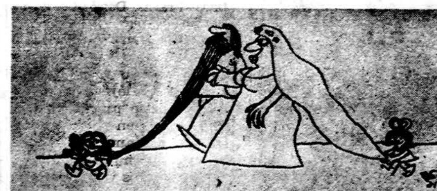
Barzdos reikšmė vestuvių metu.

Turkijoje, kaip ir kitose mahometonų šalyse, pagervinama kitas kitą, barzdon bučiuojant, ir net prisiikiama savo ar bent kilnaus pranašo Mahomedo barzda. Slavų tautos gal dar labiau už kitas senovėje barzdas gerbė, savo dievus ir vėliau šventuosius vaizdavosi barzdotus, savo barzdas puošė kaspinais ir blizgučiais, XIV amžių net Bažnyčia iškeikdavo kiekvieną, kuris skustis. Tokia tad barzdos reikšmė buvo ir dar ir dabar nežuvo.