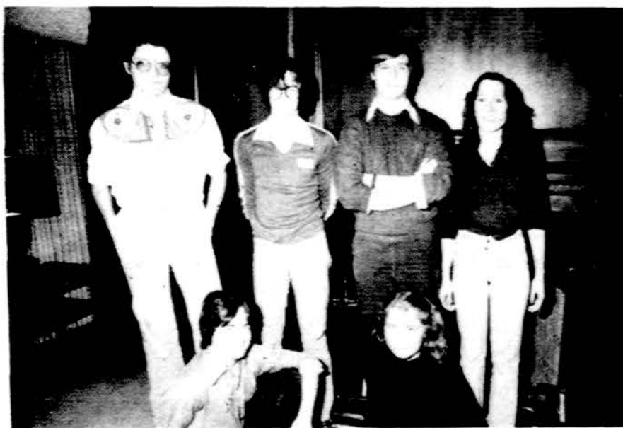
Dalis Cicero ateitininkų jaunųjų namų viename kambaryje.