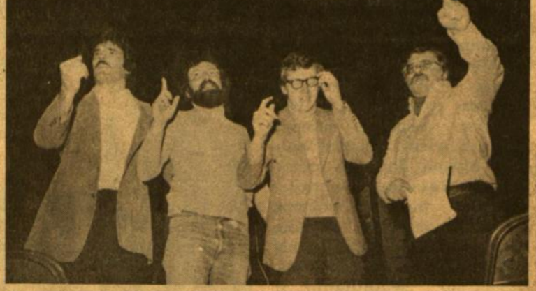
Antrą kaimo vyrai, atrodo, pakalba, pakalba, o paskui net ir uždainuoja... Antrą kaimo šių metų sezono Chicagoje premjera balandžio 25 d.