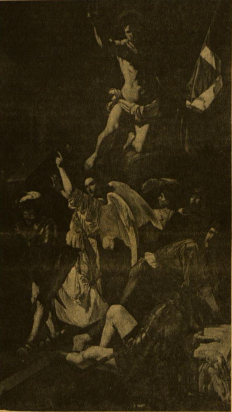
Caravaggio (italas, 1573-1610)