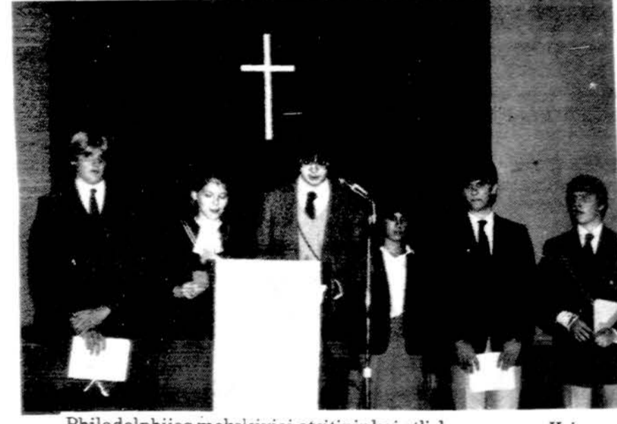
Philadelphiaje moksleiviai ateitininkai atlieka programą Kristaus Karaliaus šventėje.

XX amžiaus madona (paveikslas) apdovanotas aukščiausia premija tarptautiniame madonų meno festiva-lyje Los Angeles, Calif. ir Grand National Award Amerikos dailininkų profesinėje sąjungoje New Yorke. Tai puošni dail. POVOLO PUZINO monografija, kuri yra didelio formato ir talpina 28 spalvotas reprodukcijas. Kartu ir XX amžiaus Madoną. Kaina su persiuntimu 27 dol. Puiki dovana ir tinka bent kuriomis progomis įteikti bet kam: sveitintaui ar lietuviui. Gaunama DRAUGE, 4545 W. 63rd St., Chicago, IL 60629. Ilinojaus gy-ventojai prideda $1.50 valst. mokesčio.