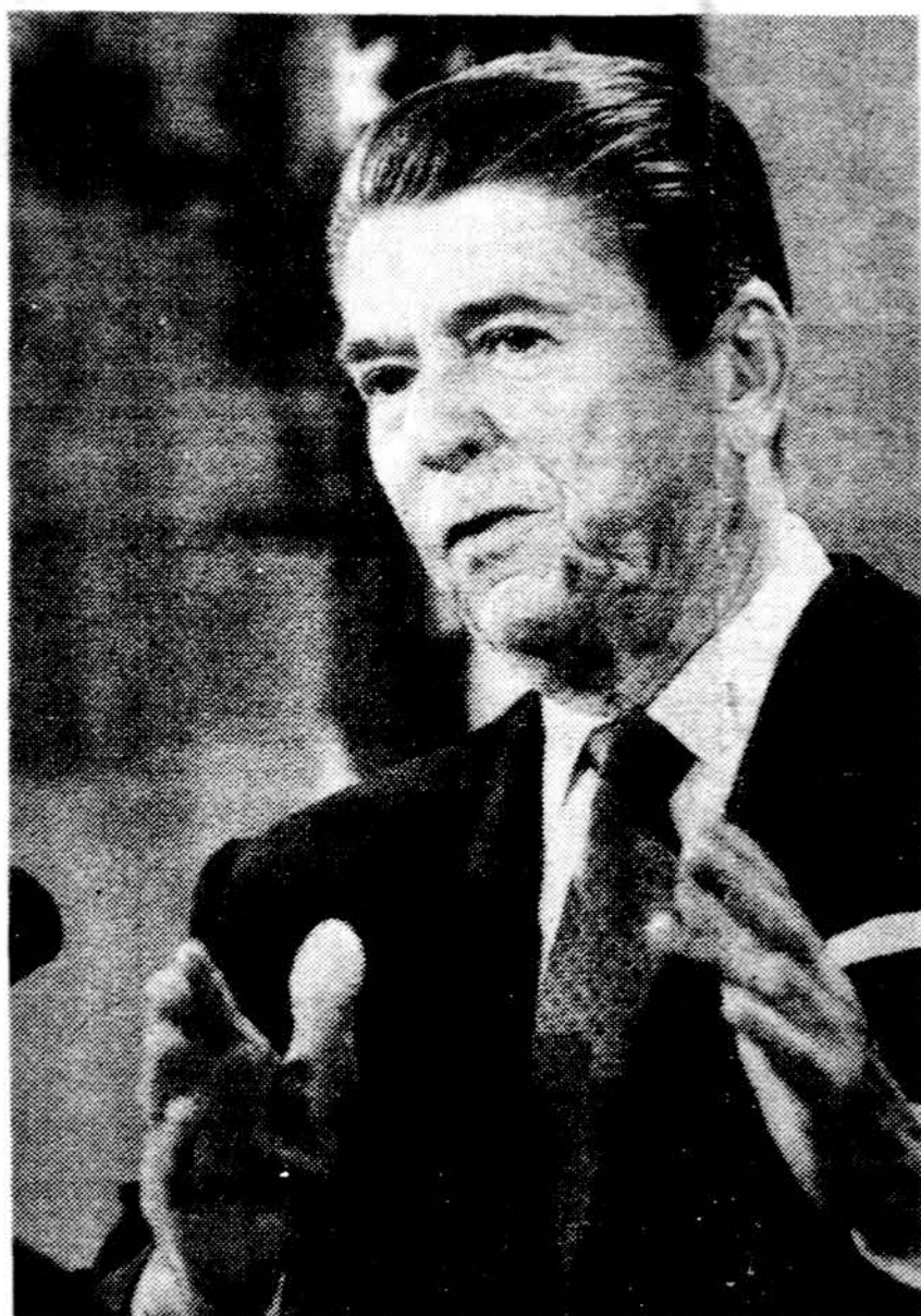
Prezidentas Reagas savo 15-toje spaudos konferencijoje pakartojė, kad ekonomija stiprėja, rodo atsivertimo ženklą. Jis pripažino, kad valstybės biudžeto deficitas kelia jam daug rūpesčių, tačiau pasisakė prieš pajamų mokesčių didinimą. Prezidentas pripažino, kad, jei reikės, jis nevenss mažinti ir gynybai skirtas lėšas.