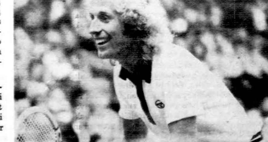
Rūpestis Vytas Gerulaitis

Šios kelionės iniciatorius buvo princas Charles, o kelionę finansavo eilė Anglijos ir Europos kompanijų. Jų pasakojimai ir nuotykiškai plačiai aprašomi anglų spaudoje.