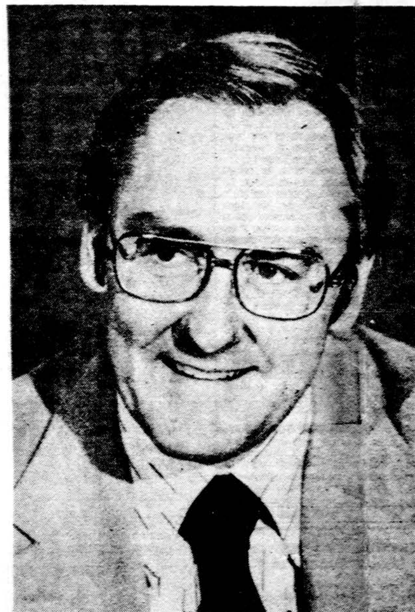
Illinois gubernatorius James Thompson vakar pradėjo savo trečiąją kadenciją.

— Indijoj neramumai vyksta Keralos provincijoje, kur policija atidarė ugnį į demonstruojančius musulmonus.