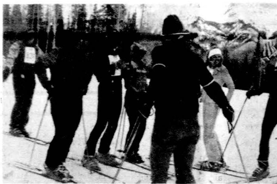
Besiruošiant L.L. Sporto žaidynių slidinėjimo varžyboms.

A. - Į pasaulinę klasę nepretenduojame. Tačiau žinant, kad Lietuvoje slalomui