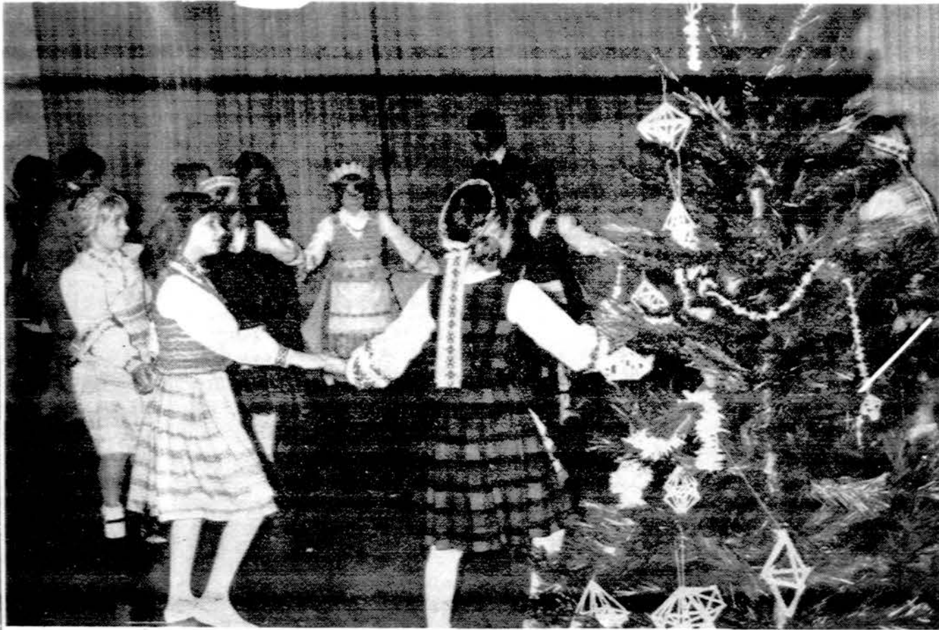
Lemonto Maironio lituanistinės mokyklos jaunimas atlieka kalėdinę programą tautiniais šokiais.