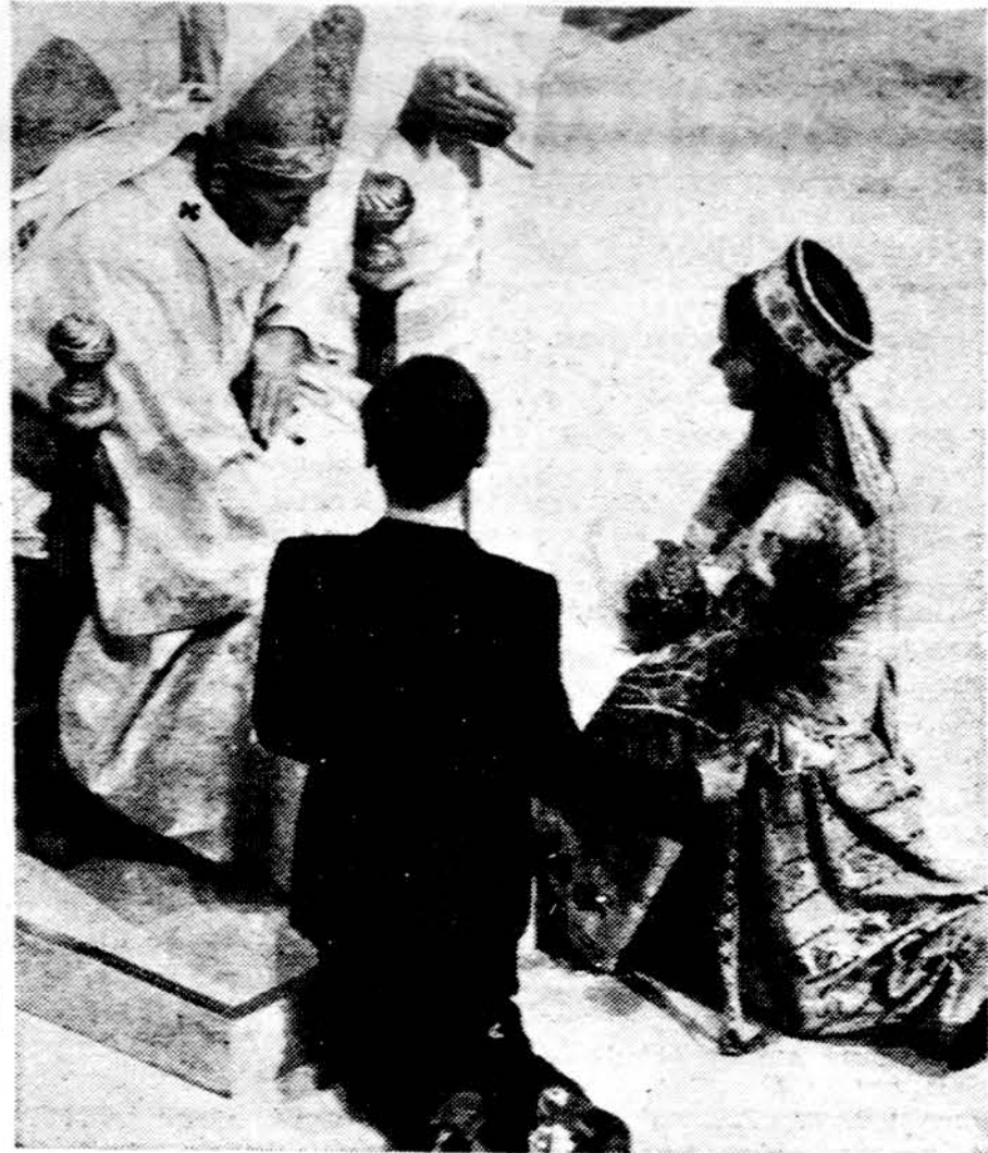
Du lietuviai jaunuoliai įteikia Kūdikielio statulėlę Šv. Tėvui Jonui Pauliui II prieš Kalėdų pamaldas. Statulėlę popiežius po šv. Mišių padėjo Šv. Petro bazilikoje.

Kitus trejus metus susirinkimo dalyviai jautė labai taktišką, bet ir aktyvią naujojo popiežiaus veiklą. Po susirinkimo pop. Paulius VI taip vadovavo antrojo Vatikano susirinkimo nutarimų įgyvendinimui, kad nežinia, ar jo vietoje kas nors kitas būtų taip sugebėjęs. Kas padaryta susirinkimo nutarimų įgyvendinimui, yra tik maža jo veiklos dalis. Tarp ki-