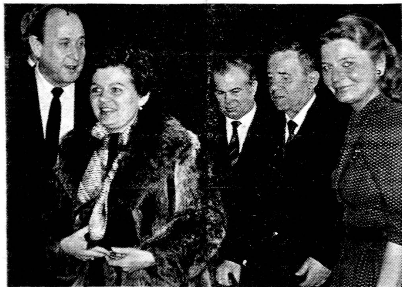
Sovietų užsienio reikalų ministeris Gromyko atvyko į Boną derėtis dėl Europos saugumo klausimų. Iš kairės: V. Vokietijos užsienio reikalų minis-

New Yorkas. — Amerikos žydų dienraščio „Jewish Daily Forward“ leidėjai paskelbė, kad nuo vasario 4 laikraštis bus savitinis. Šis „yiddish“ kalba leidžiamas dienraštis ėjo nuo 1897 balandžio 22 d. Nesenai dienraštis išvedė anglų kalbos skyrių. Leidimo išlaidoms kylant, skaitytojų skaičiui mažėjant, leidėjai priversti pereiti į savitini formata, kuriame liks ir anglų kalbos dalis. Paskutinis dienraščio numeris išeis sausio 28 d.