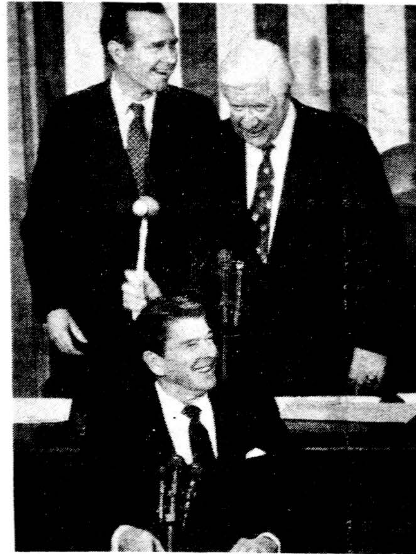
Prezidentas Reaganas pasakė Kongrese „State of the Union“ kalbą. Už prezidento: viceprezidentas Bush ir Atstovų Rūmų pirmininkas Thomas O'Neill.

— Salvadora sukilėlių radijas „Radio Venceremos“ paskelbė, kad pradėta nauja ofensyva, kurioje užmušti 46 valdžios kareiviai ir 90 paimta į nelaisvę.