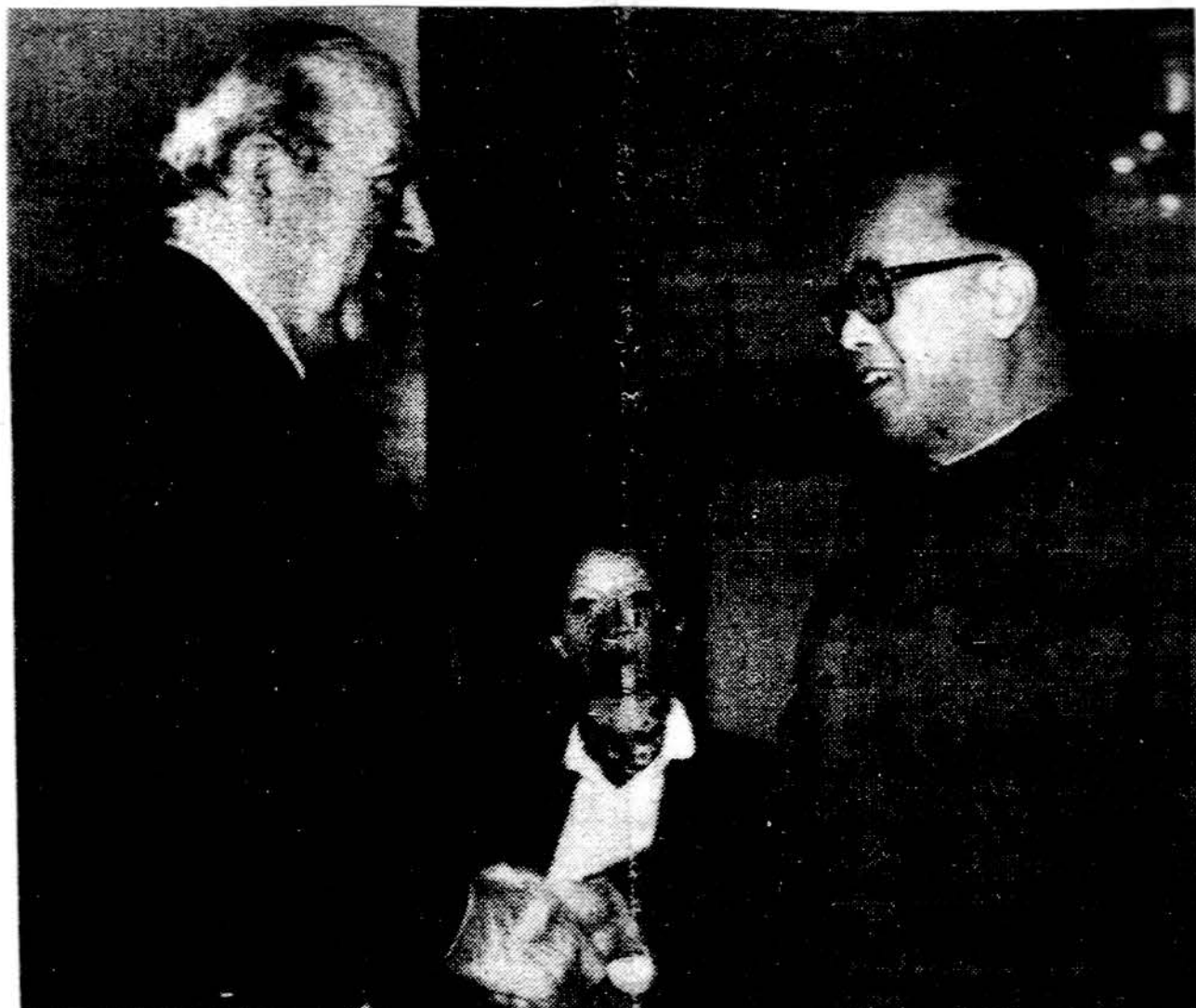
Valstybės sekretorius George P. Shultz atsiveikina su Kinijos premjeru Zhao Ziyang. Vidury — vertėja. Sveičiui išvykus į Pietų Korėją, Kinijos spaudos agentūra dar kartą pasmerkė Amerikos

ginklų pardavimą Taiwanui ir pareiškė, kad santykius su Amerika pagerinti gali „ne tušti žodžiai, bet teisingi veiksmai“.