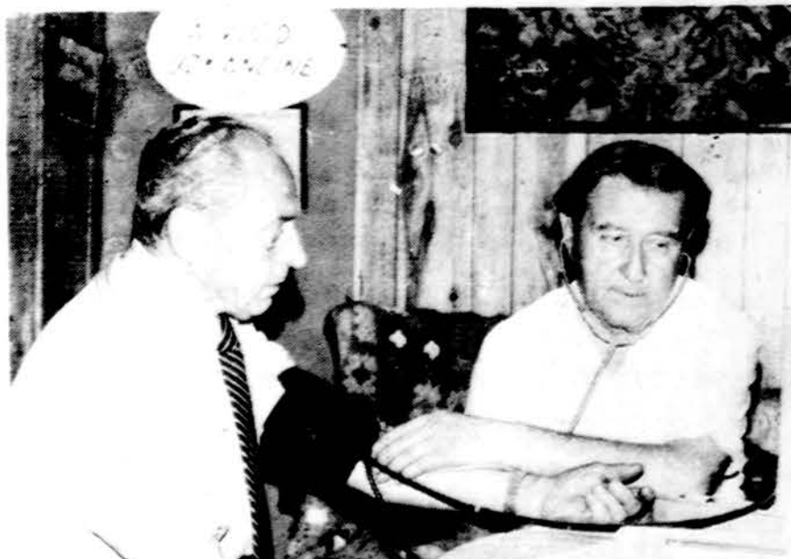
A. Visockui matuojamas kraujospūdis Sodybos ambulatorijoje.

GYDYTOJAS IR CHIRURGAS 6745 West 63rd Street Val. pirm., antr., ketv. ir penkt. 2-7; šeštadienis pagal susitarimą