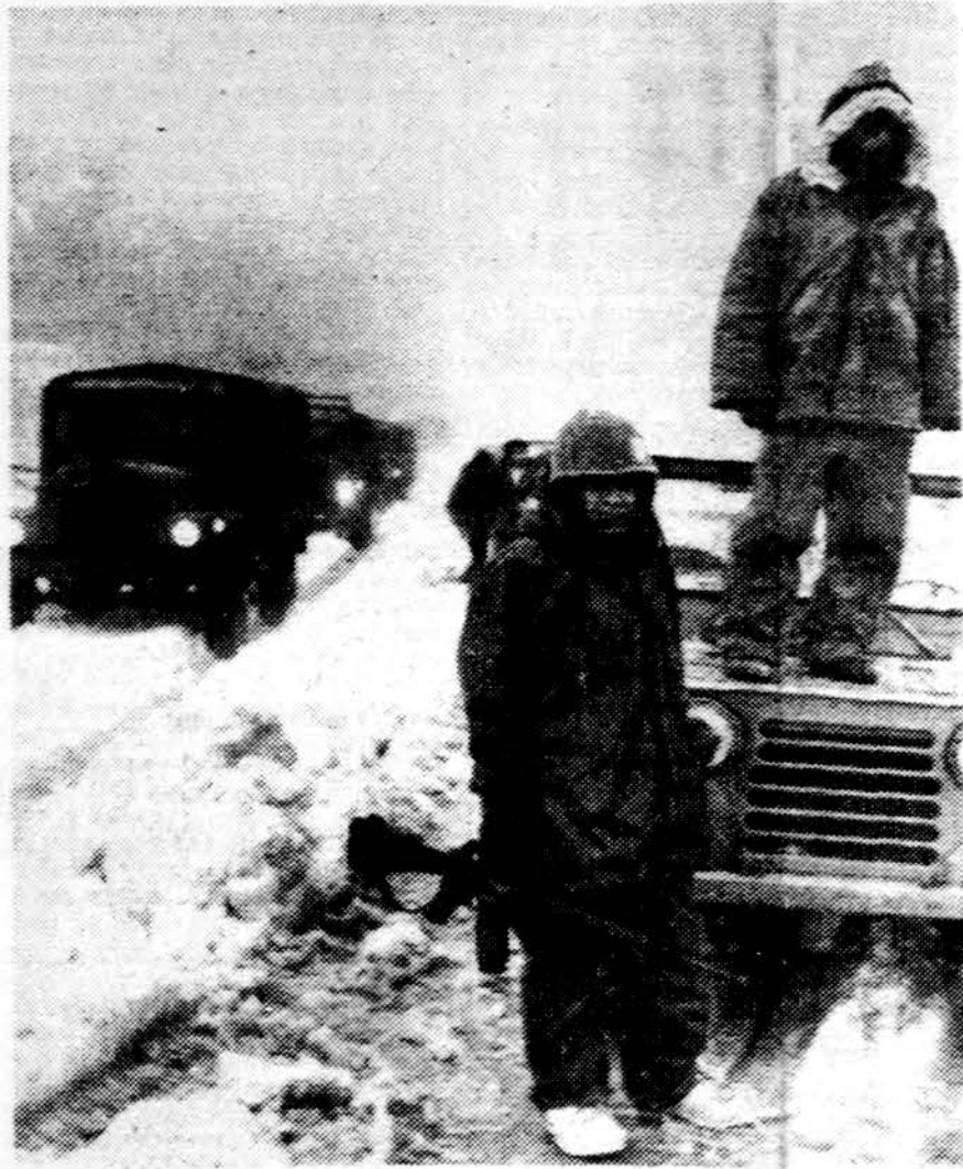
Libaną ištiko nelaukta sniego audra, šiaurinėse ir centrinio Libano apylinkėse iškrito apie 20 colių sniego, siautė smarkūs vėjai. Kariuomenės mašinos buvo panaudotos žmoniems gelbėti. Užpustytuose automobiliuose rasti 27 sušalę žmonės.

— Japonijos slidinėtųjų kurtorte sudėgė viešbutis, žuvo 11 žmonių.