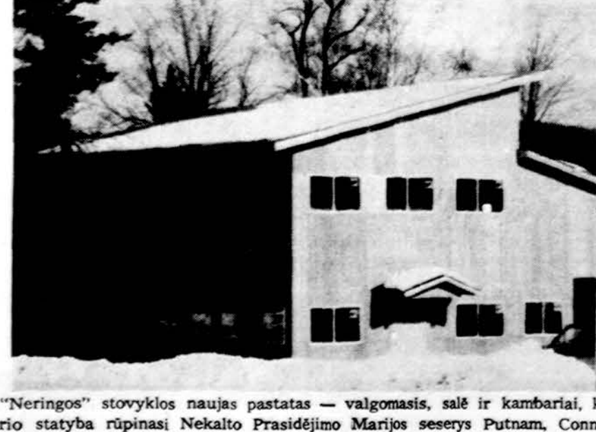
"Neringos" stovyklos naujas pastatas — valgomasis, salė ir kambariai, kurio statyba rūpinasi Nekalto Prasidėjimo Marijos seserys Putnam, Conn.

× Kelionė laivu Baltijos jūra iš Stokholmo į Helsinkį ir atgal — neužmirštama kelionės dalis "Laiškai Lietuviams" ekskursijos dalyviams — 1983 m. birželio mėn. 4 d. Informacija ir brošiūros per American Travel Service Bureau, 9727 So. Western Ave., Chicago, Ill. 60643. Tel. 312-238-9787. (sk.)