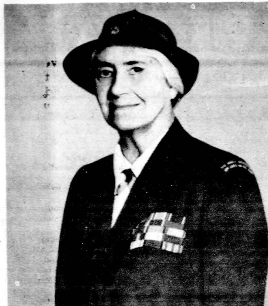
Lady Olave Baden-Powell, Pasaulio skautų šefė (1889-1977).

Šimtai tūkstančių berniukų ir mergaičių, dabar besimo- kančių mūsų idealų, ateityje bus milijonų tėvai ir motinos, kurie tuos pačius idealus skie-