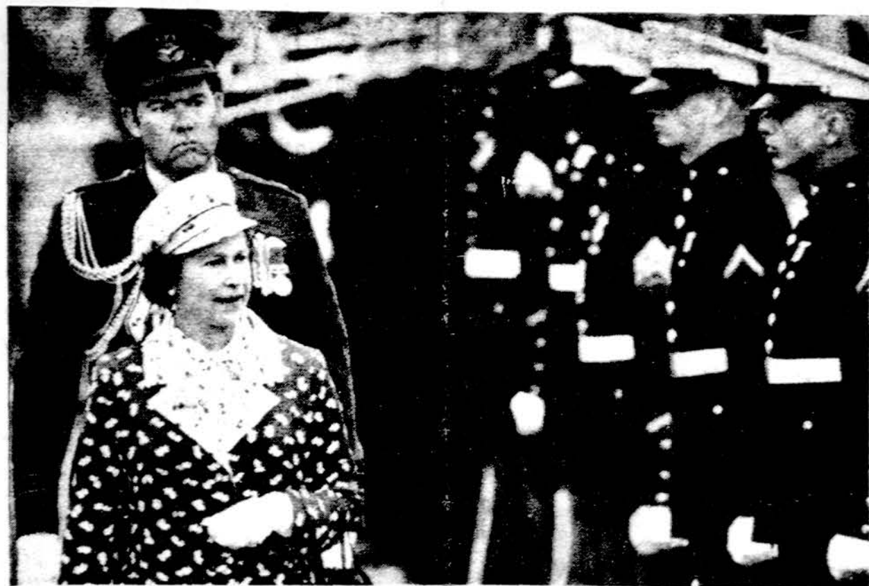
Britanijos karalienės vizitą Kalifornijoje kiek sutrukdė blogas, lietingas oras. Nuotraukoje karalienė apžiūri Amerikos marinų korpuso garbės sargybą.