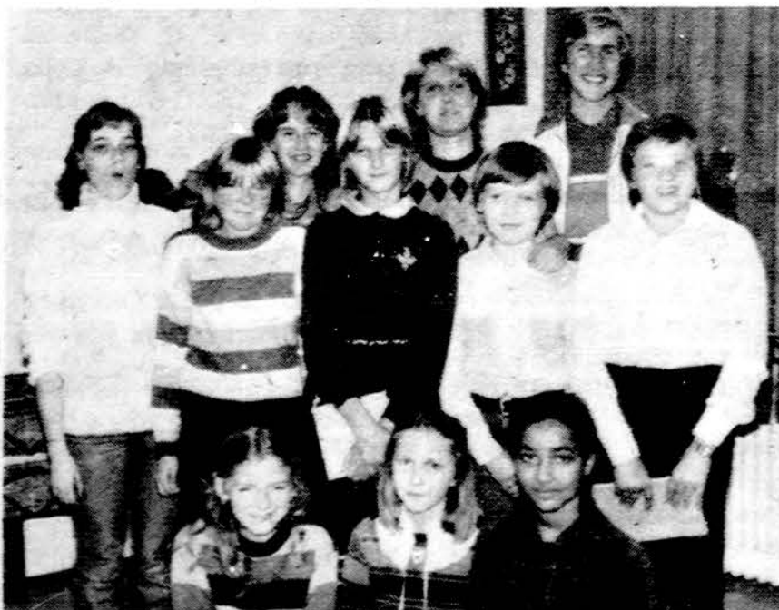
Gražaus skaitymo konkurso dalyviai Vasario 16 gimnazijoje.