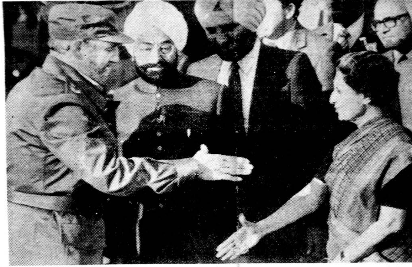
Indijoje vyksta Trečiojo pasaulio valstybių vadų konferencija. To bloko pirmininkas Kubos diktatorius Fidel Castro perdavė vadovybę Indijos premjeri Indirai Gandhi. Antras iš kairės — Indijos prezidentas Zail Singh.

Naujas Izraelio gynybos ministeris, buvęs ambasadorius Washingtono, Arens savo pirmoje kalboje parlamente pažadėjo kovoti prieš smurto veiksmus Vakarų kranto vietovėse. Bus kovojama ne tik su arabais, bet ir su žydų naujakuriais, kurie keršina arabams, „pasimdami teisinę gumą“ ir savo rankas. Ypač žiauriai puldinėjimais pagarsėjo naujakurių izraelitų Kach judėjimas, kurį įsteigė buvęs New Yorko rabinas Meir Kahane.