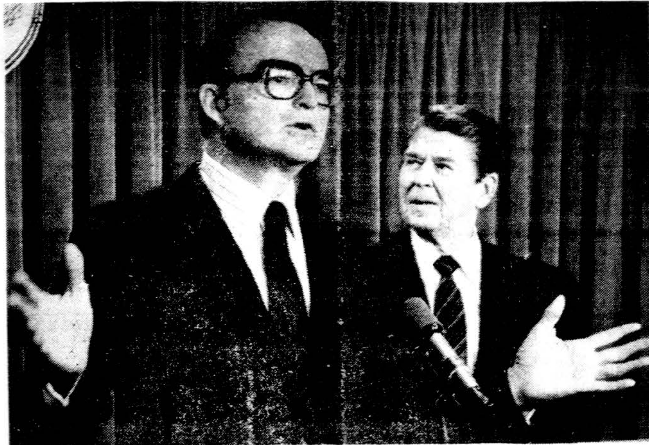
Prezidentas Reaganas su naujai nominuotu gamtos saugos agentūros direktorium Williamu D. Rickelshausu. Jis jau anksčiau yra dirbęs E.P.A. įstaigoje ir palikęs gerą įspūdį. Neabejojama, kad

— Sovietų „Pravda“ pripažino, kad gamyba sumažėjo miško ir popieriaus pramonėje JAV dolerio vertė.