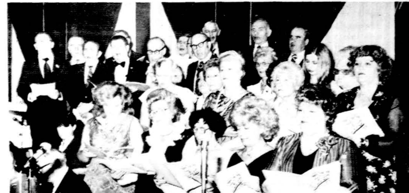
Chicagos Lietuvos vyčių choras.