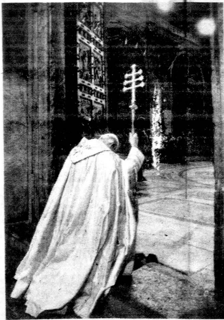
Popiežius Jonas Paulius II atidarė šv. Petro Bazilikos „Šventiasias duris“, tuo oficialiai pradėdamas Šventuosius Atpirkimo metus, kurie tęsis iki ateinančių metų balandžio 22 dienos.

— Turkija ruošia įstatymą, kuris suvaržys spaudos laisvę. Redaktoriai už valdžios kritiką gaus kalėjimo mažiausiai metus. Laikraščius provincijų gubernatoriai galės uždaryti trims mėnesiams.