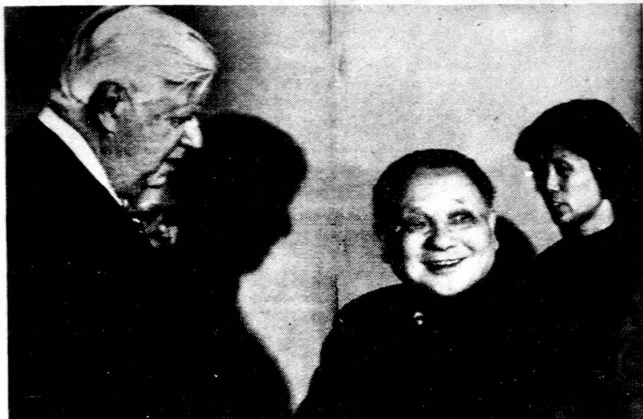
Atstovų Rūmų pirm. Thomas O'Neill baigė savo vizitą Kinijoje, kur susitiko ir su partijos vadu Deng Xiaopingu. Šis pasakė JAV Kongreso delegacijai, kad Amerikos-Kinijos santykiai pablogėjo, kai prezidentu tapo Reaganas. Santykiams

Minėtas „lietuvis“ Ben Jehuda laikomas moderniosios hebrajų kalbos kūrėju, jos „jablonskiu“.