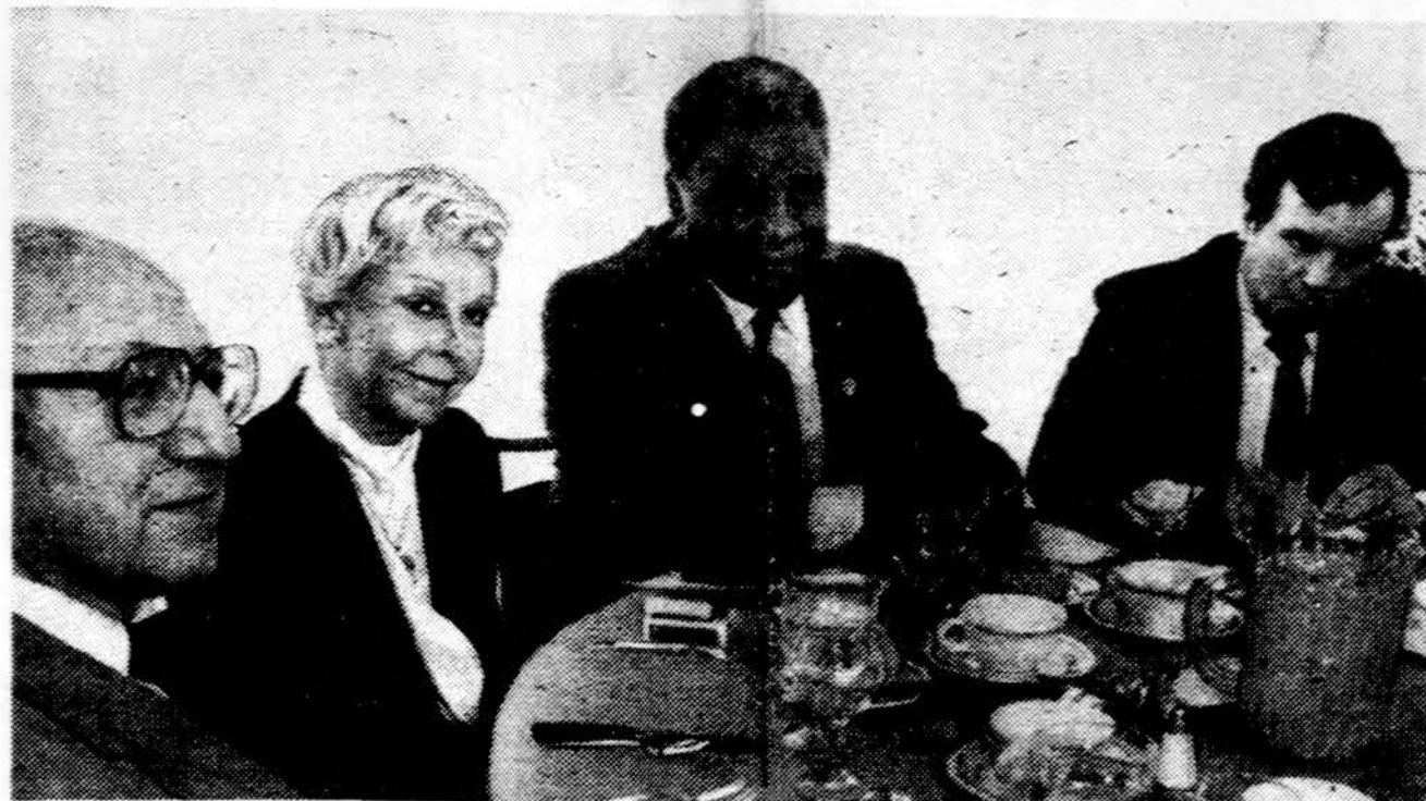
Po Chicago miesto mero rinkimų, kurių kampanijoje buvo pasakyta daug pikty žodžių, trečiadienį buvo pademonstruota vienybė ir susiklausymas. Nuotraukoje savo brolių priešpriešuos

Naujieji Kambodijos, pasivadinusios Kampučėja, pabėgėliai pasakoja korespondentams, kad vietnamiečiai valdo tik Kambodijos miestus ir kai kuriuos kelius. Naktį ir tie miestai girdi šūvius, vietnamiečių kareiviai užpildinėjami net ir dieną. Toliau iš miestų vietnamiečiai išvyksta tik didesniais būriais,