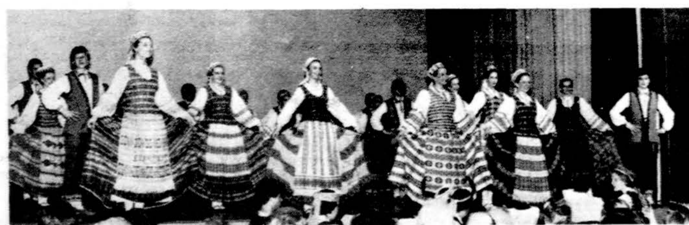
Grandinėlė savo 30 metų sukakties šventėje š.m. kovo mėn. 19 d. Clevelande.