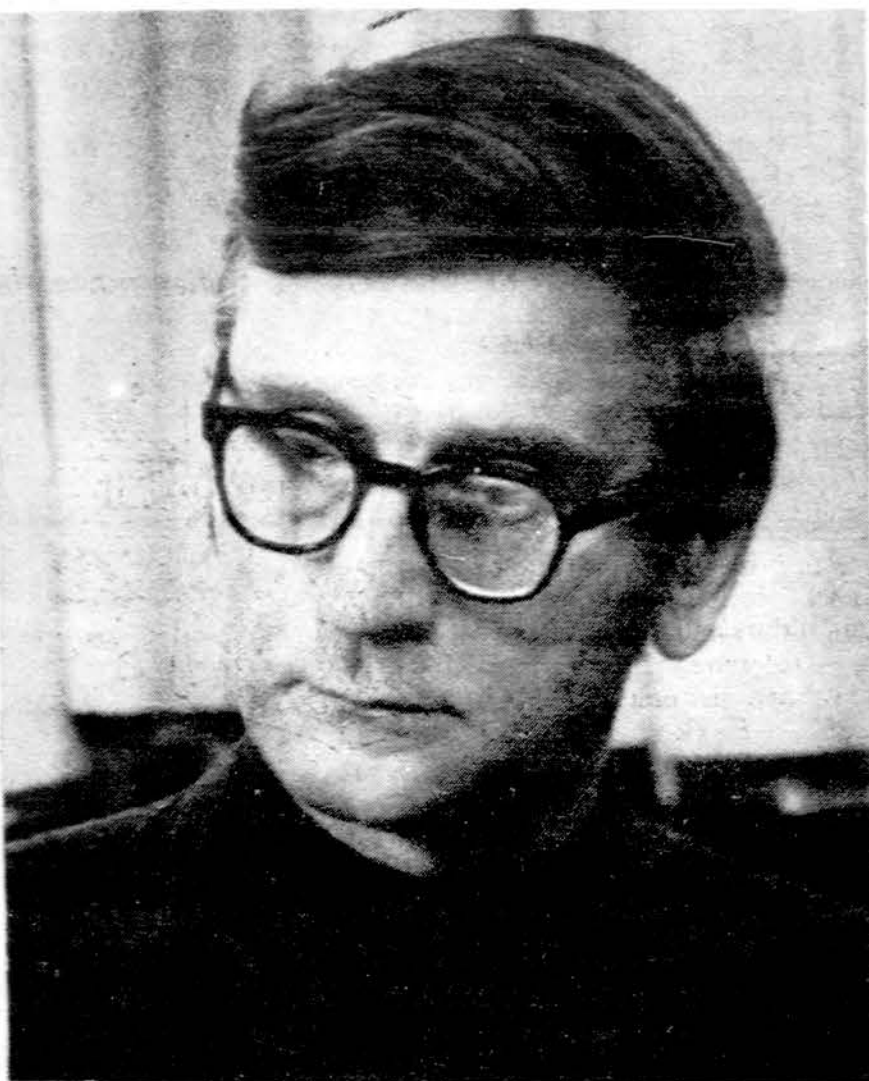
Dramaturgas Algirdas Landsbergis.

Premijuotasis rankraštis yra labai taupaus žodžio, šandieninio braižo ir šiandieninių įvykių komedija, verčianti ne tik juoktis, bet ir susimąstyti. Vaizduojama Amerikos ir okupuotos Lietuvos linksmi skaudžios lietuviškojo gyvenimo iškarpos. Tai vis aktualios ir scenoje nesunkiai įkūnijamos temos.