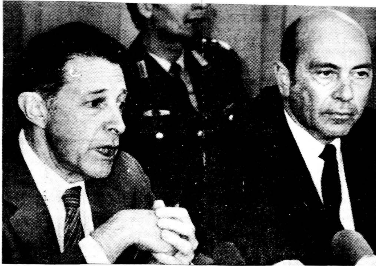
JAV gynybos sekretorius Caspar Weinberger ir Vakarų Vokietijos gynybos ministras Manfred Woerner spaudos konferencijoje Bonoje. Weinbergeris pasakė, kad sovietų grąsinimas išdėstyti savo raketą Varšuvos pakto valstybėse yra

— Buvęs bokso sunkiasis svorio čempionas Jack Dempsey mirė sulaukęs 87 m.