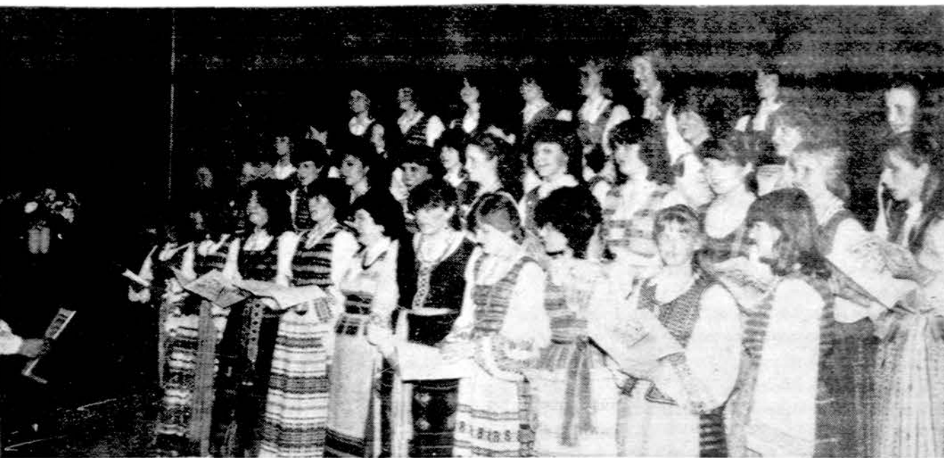
Jungtinis Hamiltono mergaičių choras "Pavasaris" ir Montrealio "Aidas" koncertuoja Hamiltone balandžio 30 d. metiniame "Aido" koncerte.

Keistai nuskamba spaudoje paliesti PLB valdybai prieštaičiai dėl nepakankamo rūpesčio švietimo, kultūros, stipendijų, jaunimo, ryšių palaikymo ir kitų reikalų. Jau minėjau, kad didžiausias stabdis yra nepakankamos lėšos. Kol PLB valdybai nebus sudarytas tinkamas finansinis pagrindas, tai vienos ar kitos srities veikla šluos. Neturėdama lėšų, nebuvo Pietų Amerikos jaunuolio, esį Vasario 16 gimnaziją, nes kelionė ir išlaikymas gimnazijoje, kainuoja bemaž 3000 dol. asmeniui. Ir kur PLB valdyba turi juos pamti? Tas pats su atoto-