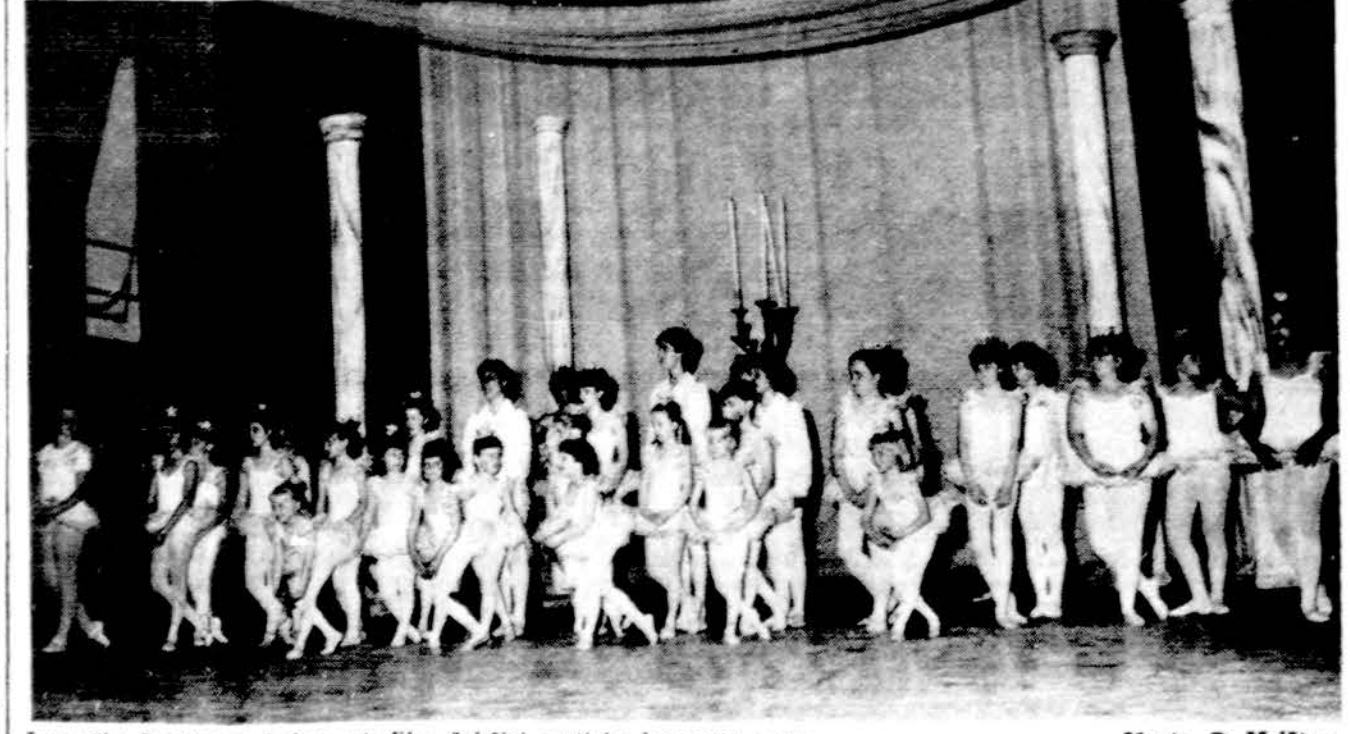
Jaunučių Puodžiūno baletų studijos šokėjų metinio koncerto metu.

3208 1/2 West 95th Street Telef. GA 4-8654