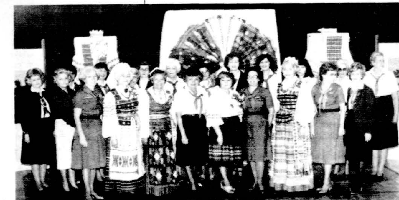
Clevelando vyr. skaučių židimečių suruoštoje darbų parodoje — ruošėjos ir menininkės. Lietuvių Tautodailės Instituto Toronto skyriaus.