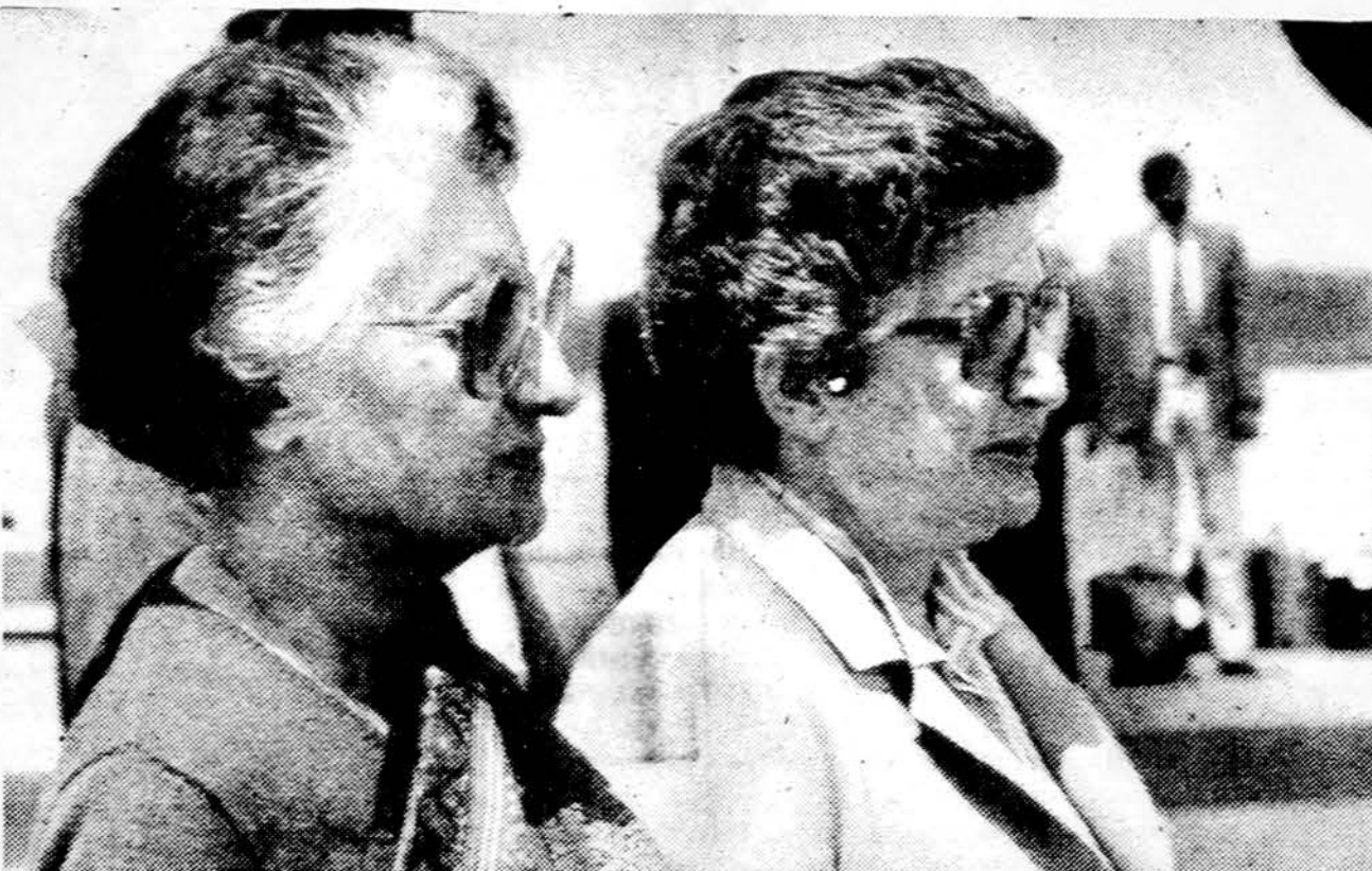
Šalia Britanijos „geležinės ponios“, premjerės Margaret Thatcher, kuri didele dauguma buvo perrinkta vadovauti Britanijai, pasaulyje yra daugiau moterų politikų. Nuotraukoje Indijos

— Libano spauda skelbia, kad PLO vadovybė ieško patalpų savo štabui įrengti. Arafatas noris vėl perkelti PLO centrą į Libaną. Patalpų ieškoma šiaurinėje Libano dalyje, Tripolio mieste.