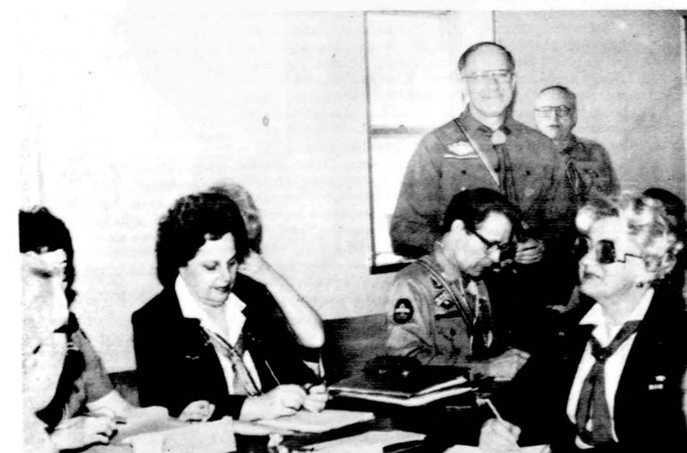
Jubiliejinės stovyklos vadovybė posėdžiauja Woodland Trails stovyklavietėje Kanadoje.

Skautų programų, jų aprūpinimo, tvarkos, sporto, išskylų reikmenimis rūpinasi Brolijos ir Seserijos stovyklų vadovai. Išskyloms skautai privalo atsivežti savus valgyimo indus. Tačiau