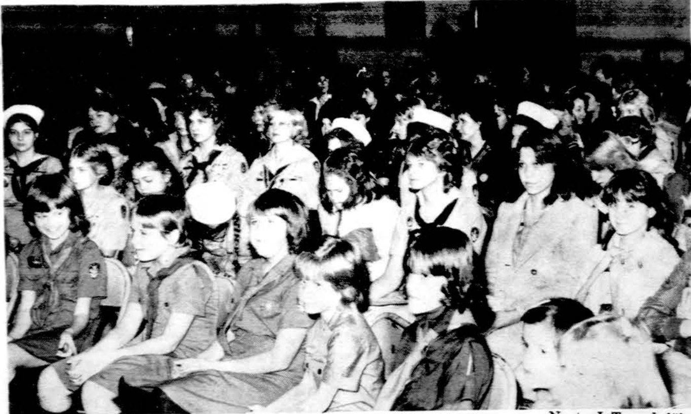
Chicago skautės (dalis) Vasario 16-tos d. sueigoje.