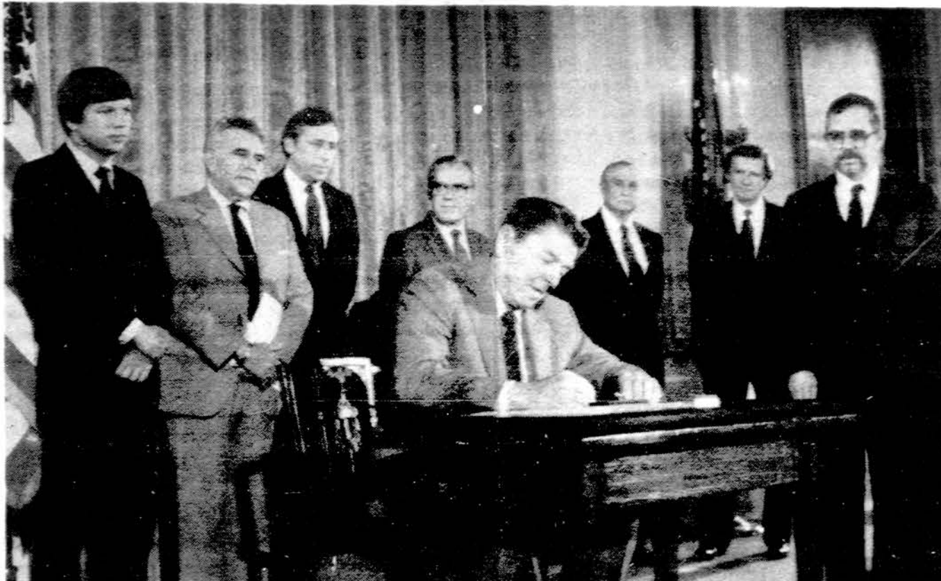
Birželio 13 d. Baltuosiuose Rūmuose prezidentas Reaganas pasirašė proklamaciją, kuri skelbia birželio 14 d. 1983 m. Baltijos Laisvės diena. Prezidentas priminė savo kalboje, kad 1941 birželio 14 prasidėjo masinės Baltijos valstybių žmonių deportacijos. Prezidentas pasakė, kad JAV turi neleisti laisvės švyturiui užgesti. Tai yra mūsų

— Vakarų Berlyne įvyko mištinės tarp „naujųjų nacių“ ir „kairiųjų“. Policija suėmė 203 asmenis.