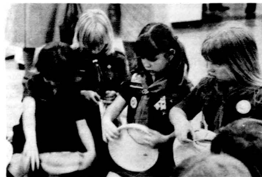
"Saulučių" skilties sesės atlieka uždavinį skautoramoje.