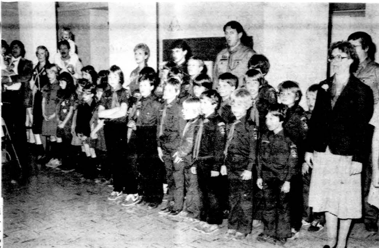
Vilkiukai ir paukštytės su savo vadovais ir vadovėmis bendroje "Aušros Vartų" ir "Litanicos" tuntų Motinos dienos sueigoje.