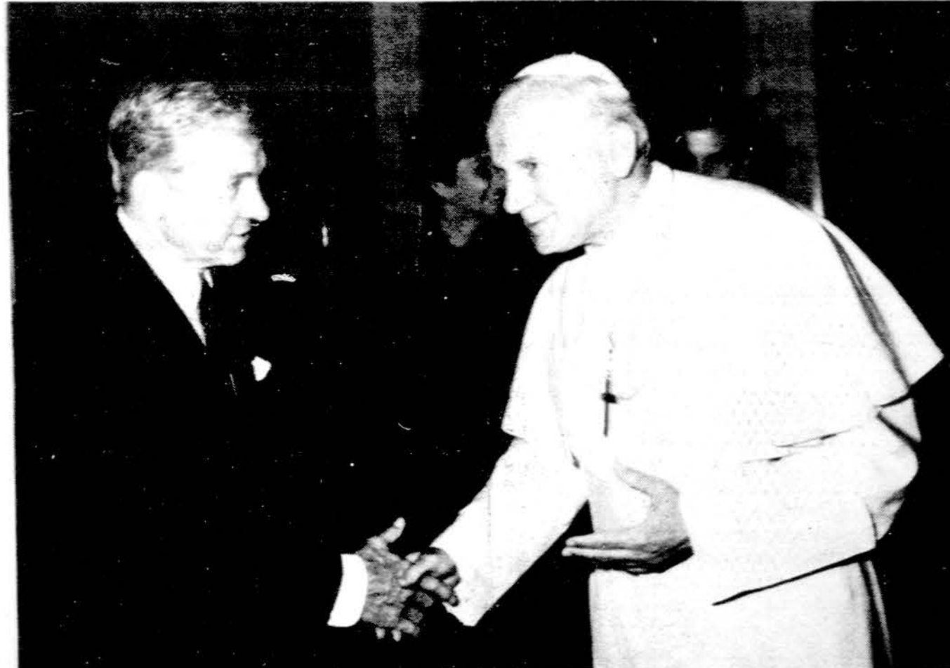
Birželio 4 d. popiežius Jonas Paulius II priėmė senatorių Charles H. Percy ir kitus senatorius. Savo pareiškime popiežius linkėjo stiprumo ir patvarumo, siekiant tiesos ir teisingumo, pažadėjo prisidėti savo laiminimu ir maldomis už senatorius ir visus amerikiečius.

O žmonės, žmonės, žmonės, Ar jums manęs reikėjo? Ar jums nors kiek padėjau? Sakyk man, netylėki, Ar šito Tu norėjai? Ar šito Tu norėjai? (Bus daugiau)