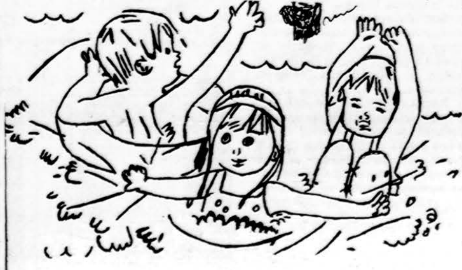
Vasara prie ežero

Pasakyk greitai: "Bėgo avelė pro pakapnį, pro pusprakapnį ir pro prakapnėlį". (Dukštas)