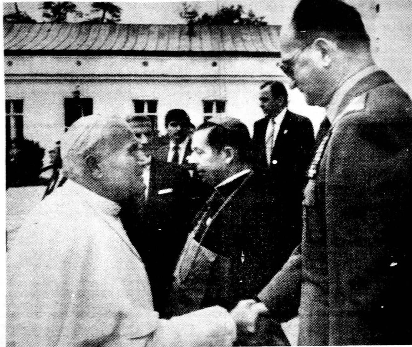
Lenkijos spauda ir televizija plačiai paskleidė šią nuotrauką, kur popiežių Joną Paulių II sveikina generolas Wojciech Jaruzelski. Viduryje stovi Lenkijos katalikų primas kardinolas Jozef Glemp.

Lenkijos valdžios televizija rodė V. Vokietijos „revanšistų“ susirinkimą, kuriame buvo kalbama apie „vokiečių