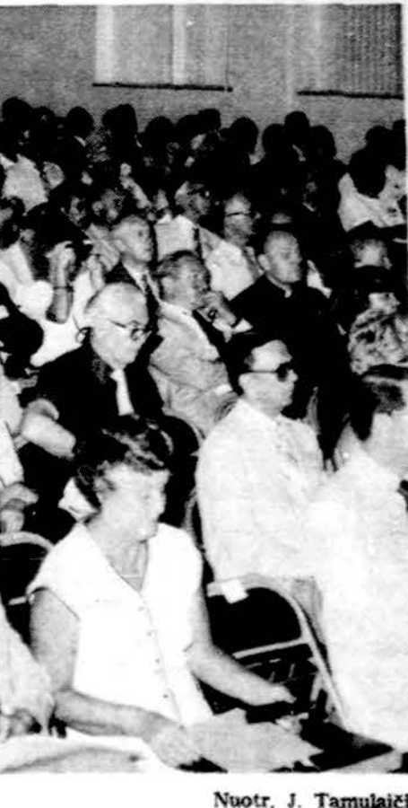
Dalis susirinkusių į Pasaulio Lietuvių Bendruomenės sei mo atidarymą.

BYRNE NAUJOJ TAENYBOJ Buvusi merė Jane Byrne dabar pasamdyta patarėja Windsor Industries, Inc., firmoje, 1304 S. Indiana Ave., Chicagoje.