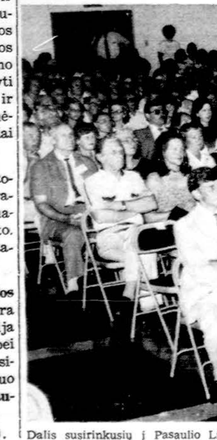
Dalis susirinkusių į Pasaulio Lietuvių Bendruomenės sei mo atidarymą.