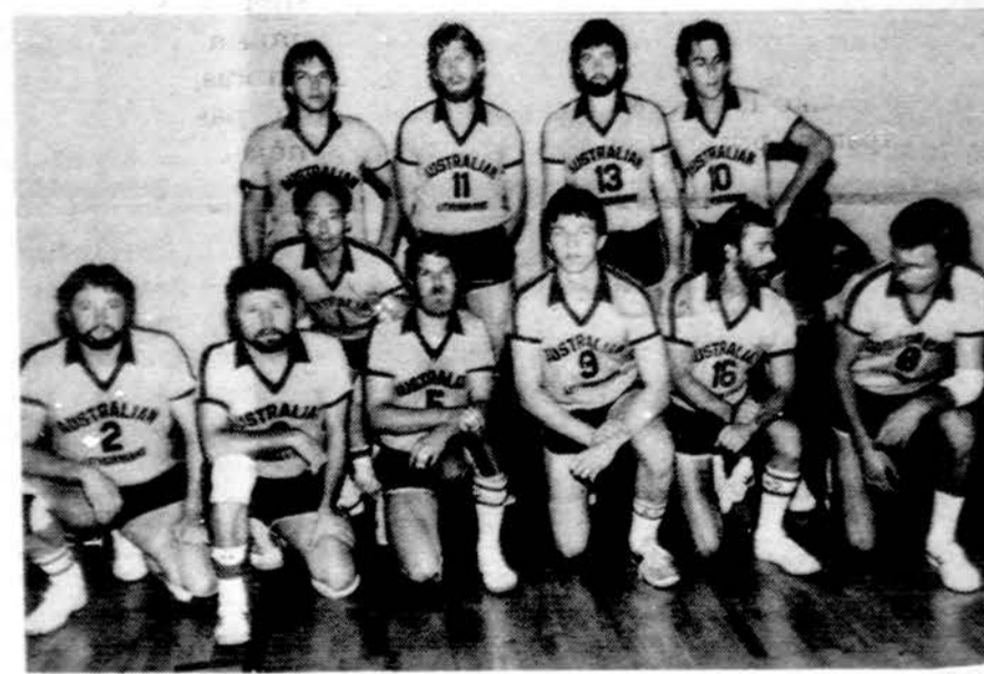
Australijos tinklininkai Detoite.

Grįžę į namus su bronzos medaliais ir nelabai patenkinti, mūsų garsūs krepšinininkai poilsio ir atostogų negavo. Tučiuojau pradėjo ruošti spartakiadai, kurios dauguma varžybų jau baigėsi. Lietuvos moterų rinktinė spar-