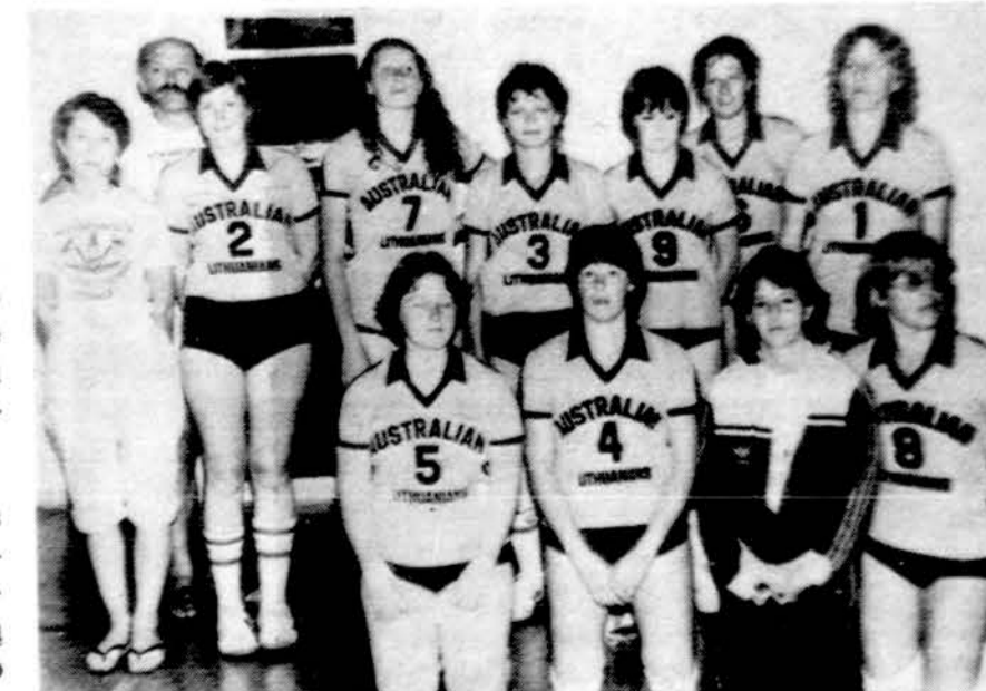
Australijos lietuvaitės tinklininkės po rungtynių Detoite.