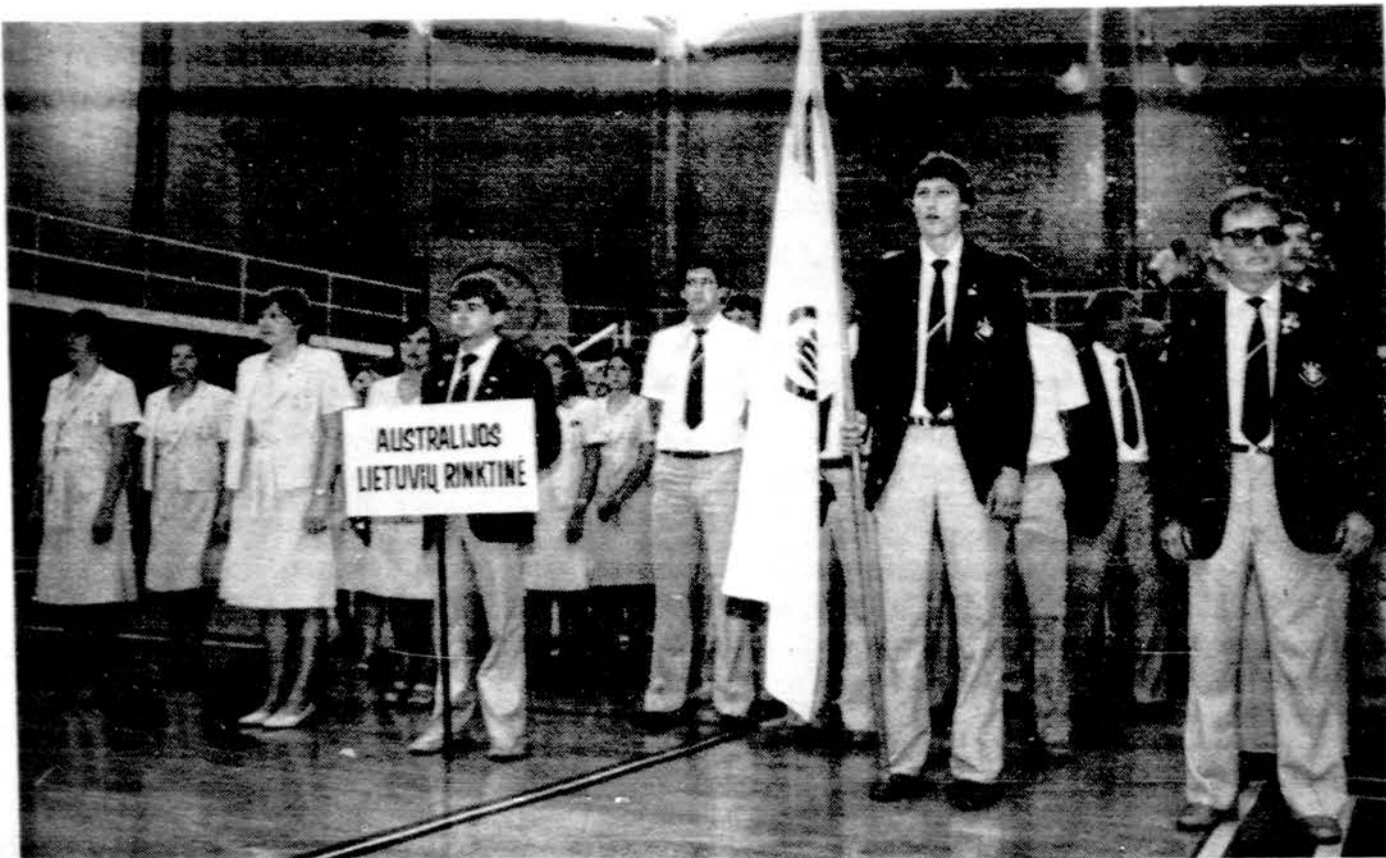
Australijos lietuviai sportininkai II-jų PL Dienų Sporto Žaidynių atidaryme.

Žinoma, didžiausią dėmesį ir daugiausiai žiūrovų (kaip visada), sutrauks tinklinis ir krepšinis. Tinklinio finalai