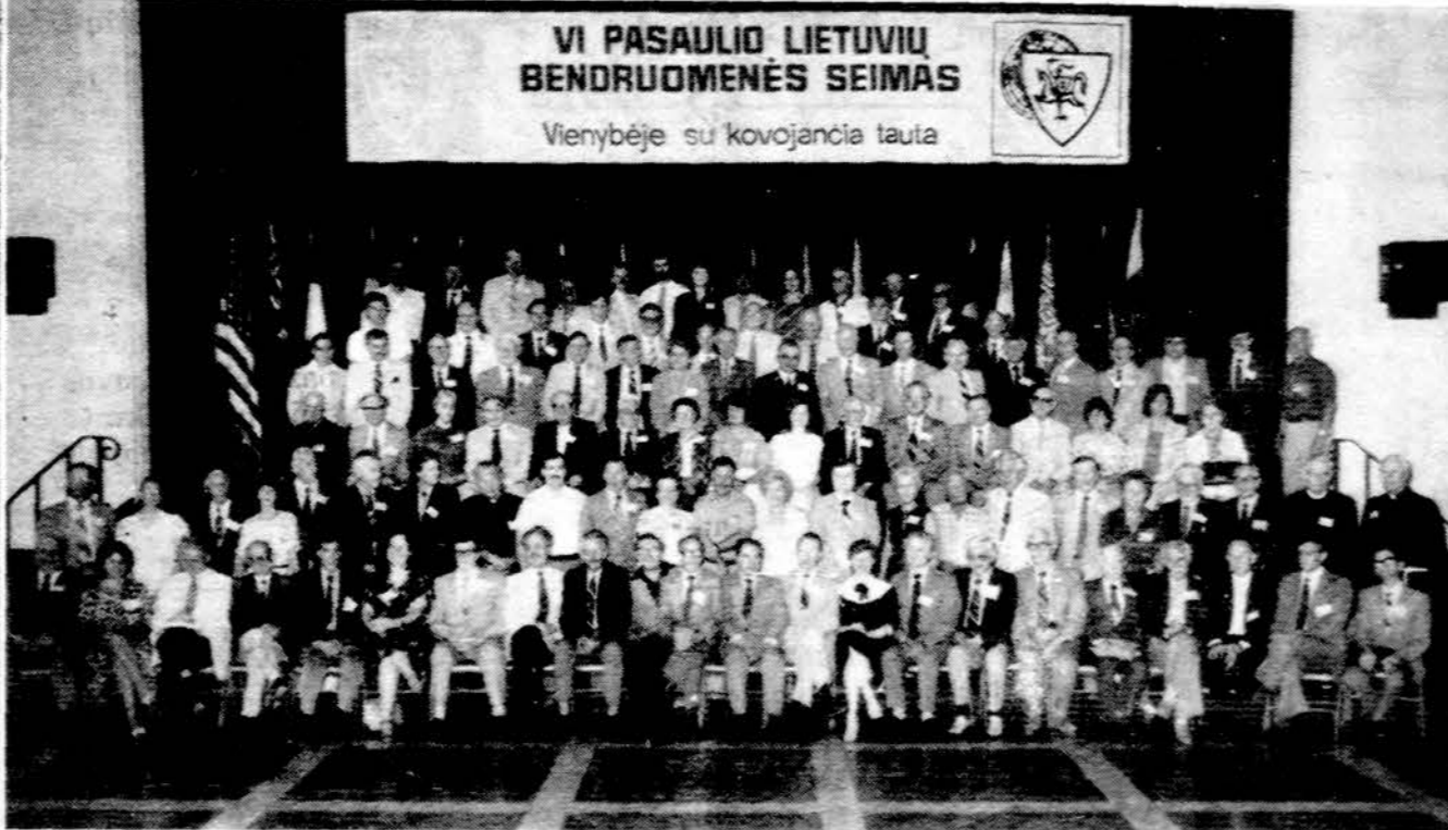
Pasaulio Lietuvių Bendruomenės atstovai ir svečiai baigiantis PLB seimui.