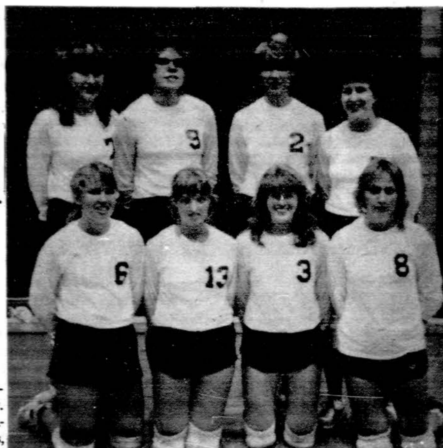
Chicago "Žara" laimėjusi tinklinio meistro titulą.

50 m delfinu: I v. — M. Taraška (Ž.), A. Bankaitis (Ž.) ir 3 v. — V. Taraška (Ž.).