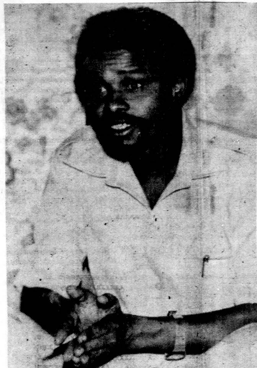
Čado prezidentas Hissen Habre pranešė spaudai, kad kariuomenė sumušė sukilėlius ir atsėmė tris miestus, kurie buvo sukilėlių paimti šio karo pradžioje. Jis apeliavo į Prancūziją, kad ji atsiųstų savo kariuomenės dalinį. Prezidentas pasmerkė Libiją, kuri ginklais ir patarėjais remia sukilėlių jėgas.

ypač kai dabartinėmis sąlygomis tik šeimų židiniuose tėra leidžiamas krikščioniškas auklėjimas, ir žalinga įtaka gresia vaikų religiniam ir moraliniam gyvenimui. Bažnyčia pageidauja tik tiek veikimo laisvės, pažymėjo popiežius, kad galėtų tarnauti tautos gerovei ir padėti įgyvendinti jos giliausius troškimus. Bažnyčia visada siekia atviro dialogo su visuomene, Bažnyčia didžiai vertina kiekvieną pastangą užmegztį su ja bendradarbiavimo ryšius ir kiekvieną geros valios ženklą jos atžvilgiu iš civilinės valdžios pusės, kaip, pavyzdžiui, neseniai gautą leidimą pasiūti į Kubą kelis vienuolius pastoviai tarnybai bendruomenėje. Dieve duok, pažymėjo baigdamas popiežius, kad tai būtų vilties ženklas ateičiai.