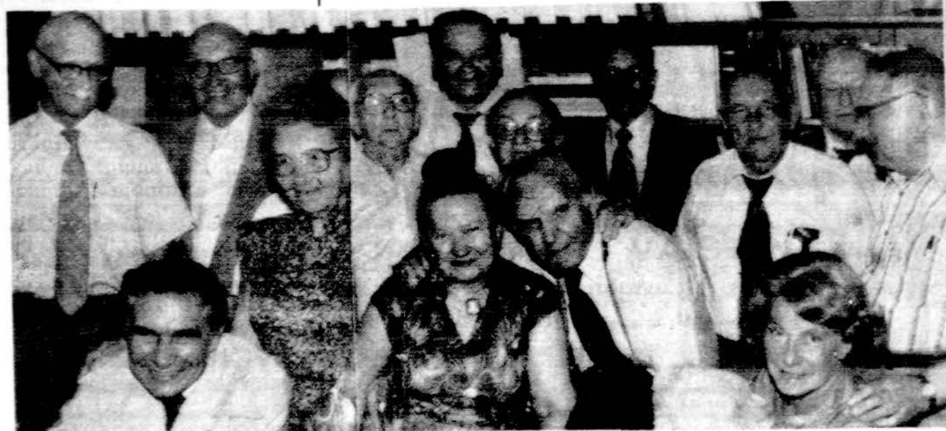
Liepos 2 d. Chicagoje įvyko varpininkų liaudininkų veikėjų suvaziavimas. Nuotraukoje dalis suvaziavimo dalyvių pokyvių metu.