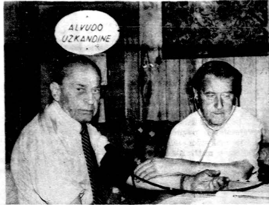
A. Visockui matuojamas kraujospūdis Sodybos ambulatorijoje.

SKANIAUSIŲ — SVEIKIAUSIŲ DARŽOVIŲ MIŠINYS Klausimas. Gerb. Daktare, prašau patarti, kaip pasigaminti sveiką ir skanų daržovių mišinį. Amerikiečių spaudoje labai dažnai paduo-