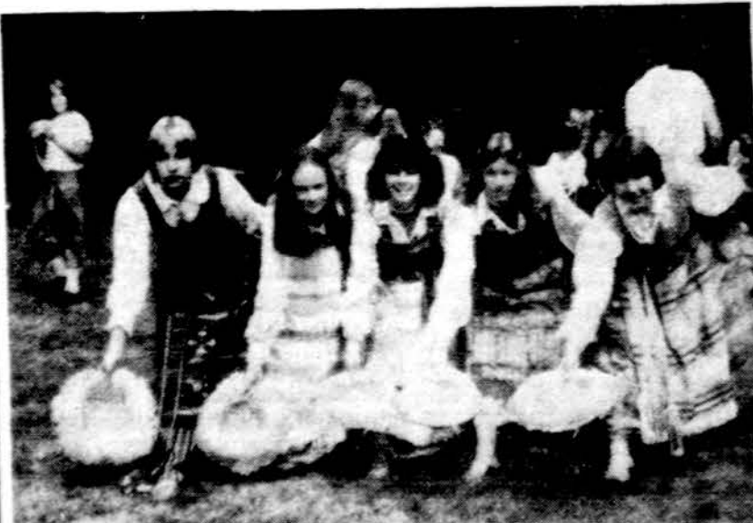
N. Pr. Marijos Seserų Vienuolyno Sodyboje Putnam, Connecticut