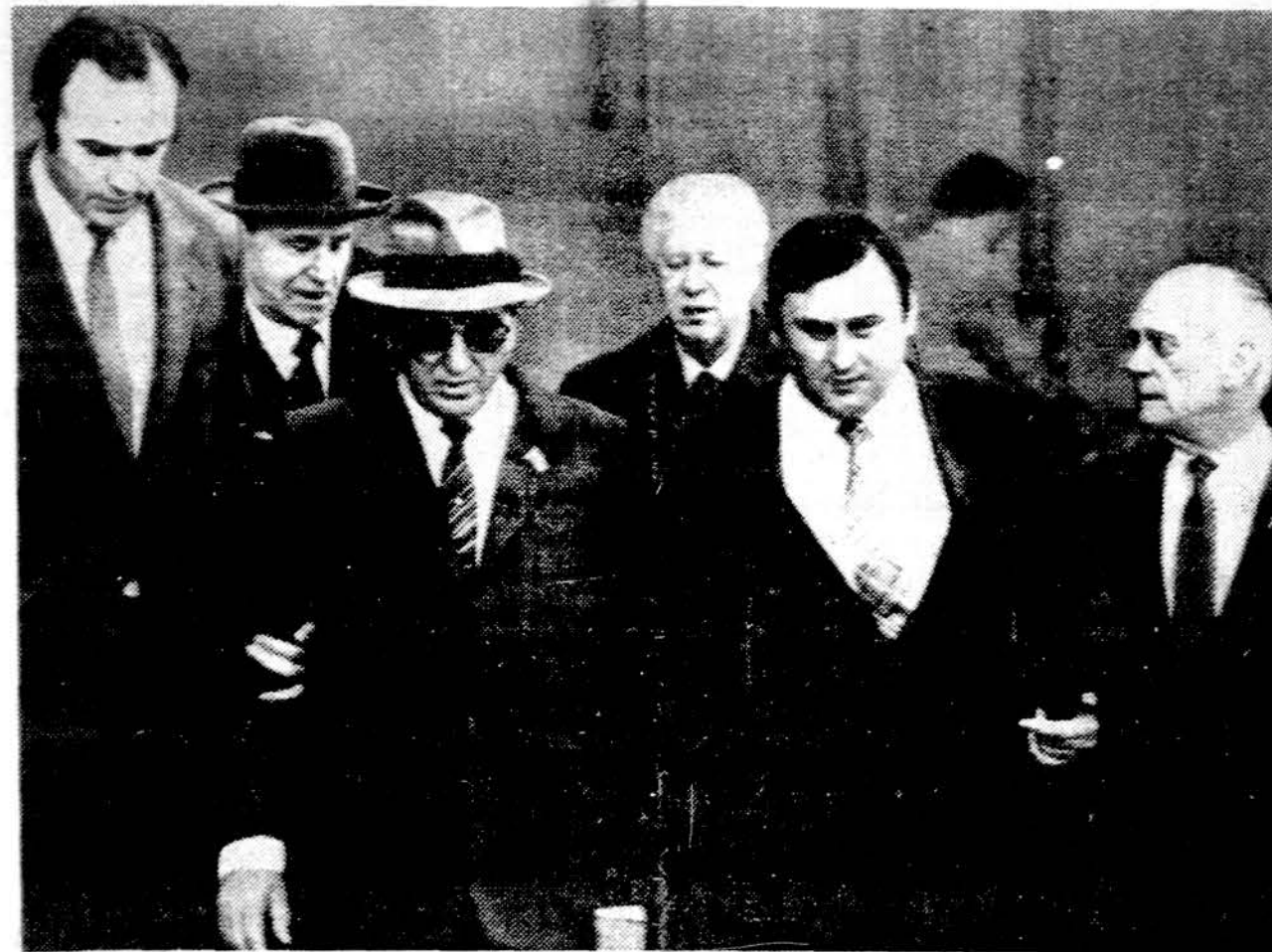
Maskvoje sklinda daug gandų apie silpnėjančią generalinio sekretoriaus ir prezidento Juro Andropovo sveikatą. Šioje AP nuotraukoje Andropovas sunkiai paėina tarp dviejų stiprių saugumiečių. Užsienio reikalų ministeris Gromyko užpakalyje, antras iš kairės. Premjeras Nikolai Tichonov — dešinėje.