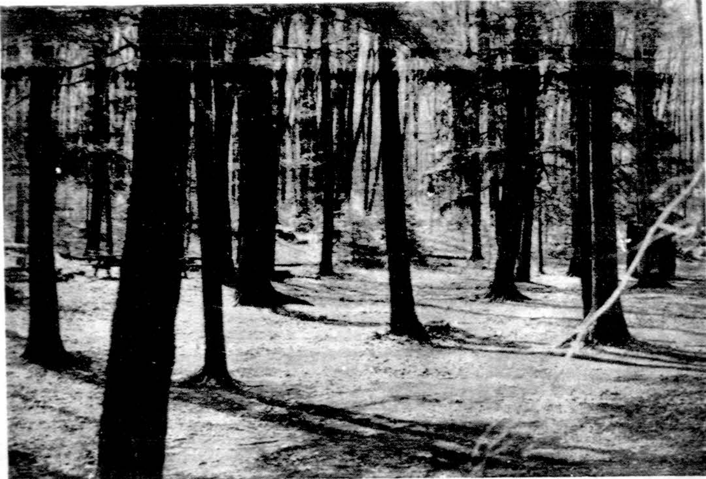
Miškas laukia Jubiliejinės stovyklon atvykstančių sesių ir brolių

— Visi dalyviai ir svečiai stovyklautojai privalo atsižvelgti miegamais ir lauko lovelėmis, pripučiamus matrasus ar