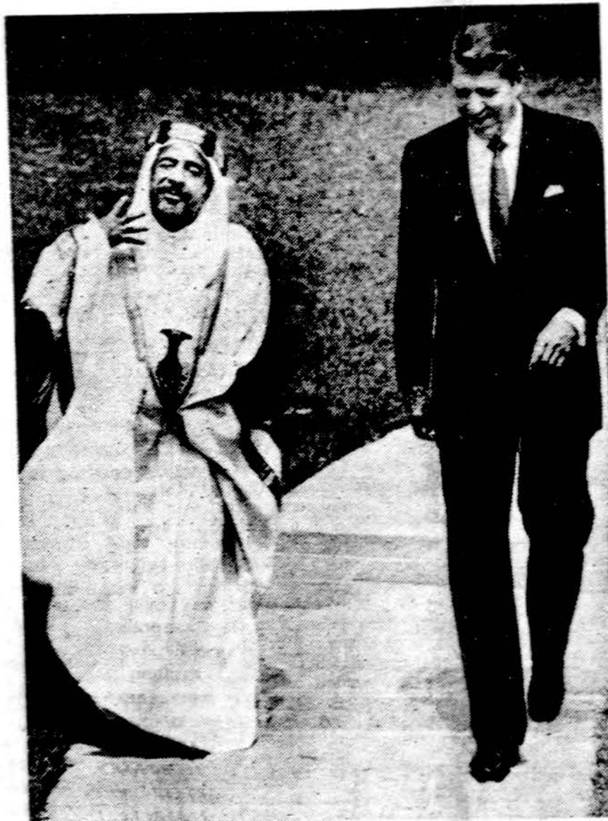
Prezidentas Reaganas išlydi iš Baltųjų Rūmų Bahraino emirą, šeiką Sulman al-Khalifa, su kuriuo kalbėjosi visą valandą. Buvo aptarti Vidurinių Rytų ir Persų įlankos klausimai. Abiejų valstybių vadai pasisakė už taiką ir pastovumą toje pasaulio dalyje. Bahrainas yra nedidelis, tačiau turtingas kraštas, kuris savo uoste leidžia suestoti ir pagalbiniams JAV karo laivams.

— Izraelio spauda rašo, kad ministeris be portfelio Ariel Sharon planuoja pasitraukti iš kabineto, nes daugumas nepriitaria jo pažiūroms į Izraelio gynybą.