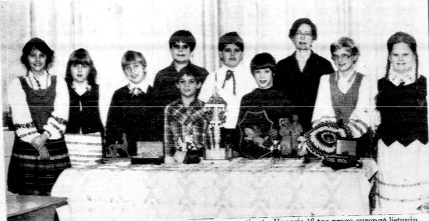
Clevelando Šv. Kazimiero lituanistinės mokyklos 6 skyriaus mokiniai, vadovaujami mok. Ješ-