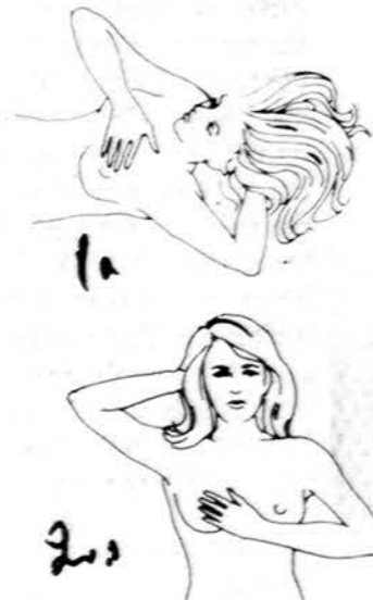
Atsimintinos ir kitos smulkmenos pačiai krūtis tikrinant

Moteris atsistoja prieš veidrodį, laikydama abi rankas už pakalyje galvos. Tada ji stebi galimas ketveriopus pakitimus: 1. krūčių kontūrų pasikeitimą; 2. sutinimą; 3. spenelio įsitraukimą; 4. suspaudus spenelį žiūrima, ar joks skystis neišteka iš jo.