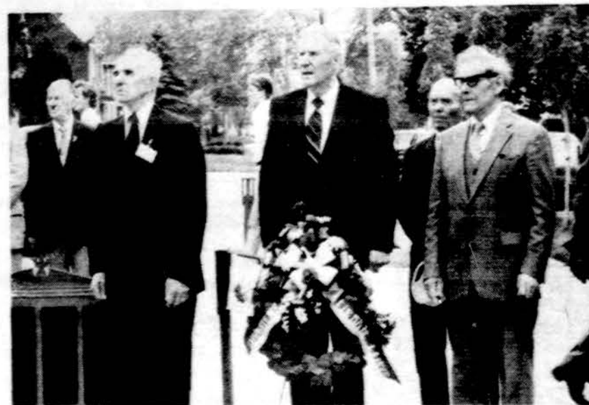
LKVS Ramovės nariai Clevelande vainiku pagerbia žuvusius kovose už Lietuvos laisvę.

Skaitykite ir platinkite dienr. "Draugą".