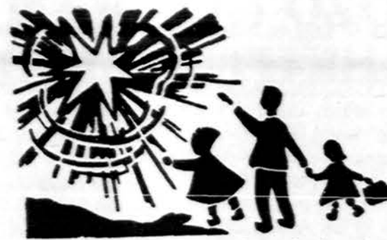
Redaguoja J. Placas. Medžiagą siųsti: 3206 W. 65th Place, Chicago, IL 60629