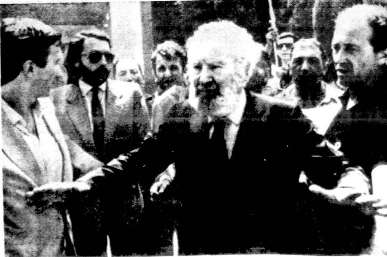
Mussolinio sūnus Vittorio Eisenos prieky.