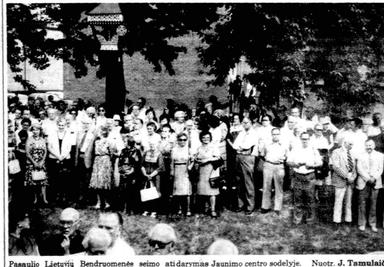
Pasaulio Lietuvių Bendruomenės seimo atidarymas Jaunimo centro sodelyje.