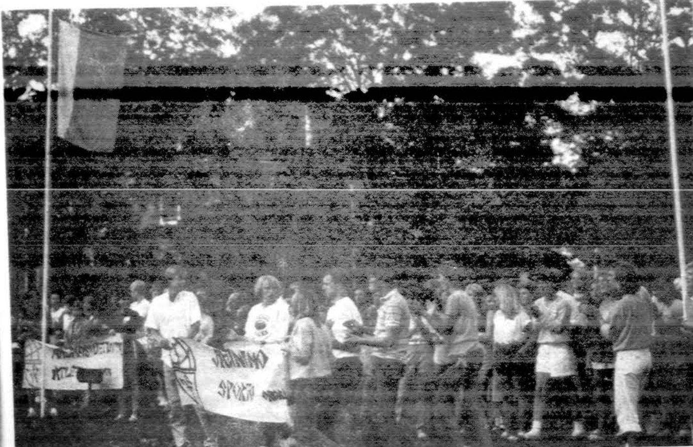
Stovyklaujantis jaunimas Oberlin College, Ohio, sporto dienose