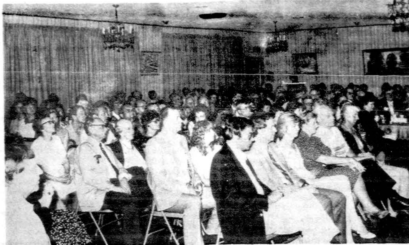
Dalis publikos Pasaulių Lietuvių dienų kultūriname renginyje Lietuvių Tautiniuose namuose.