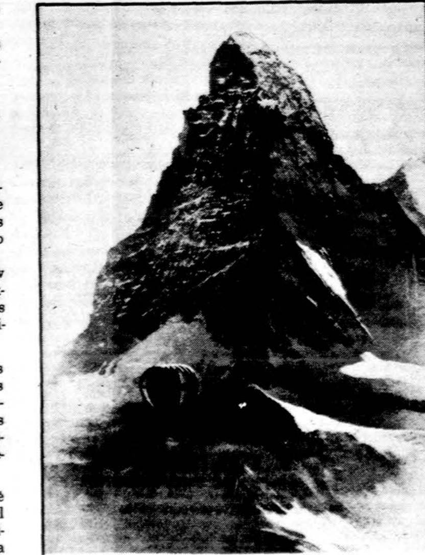
Matterhorn, 14,689 pedų vienas pačių garsiausių kalnų Šveicarijoje, pasidarė labai mėgstamas alpinistų. Įkopimas nėra sunkus, tai kasdien bando kopti vidutiniškai apie 100 asmenų. Pasirodo, jo viršūnė kai kas nori pasiekti ir balionais.

Atstovų rūmų pirmininkas Thomas O'Neill Reagano kalbą pavadino tik priešrinkimine kalba, propaganda, nieko daugiau.