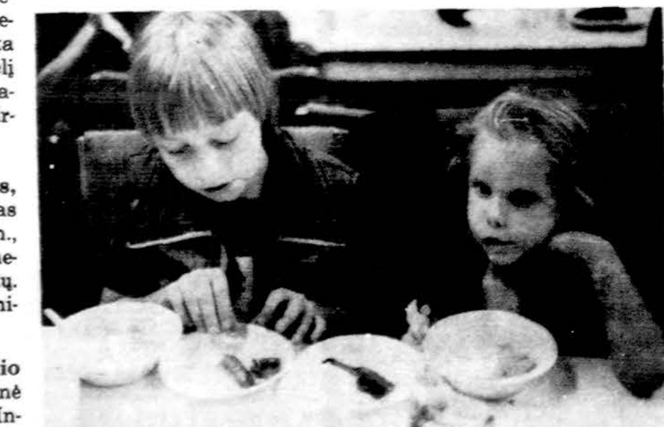
Lietuvių Skautų Seserijos Jubiliejinė stovykla "Aušra". Dienos pabaigoje net valgyti sunku.