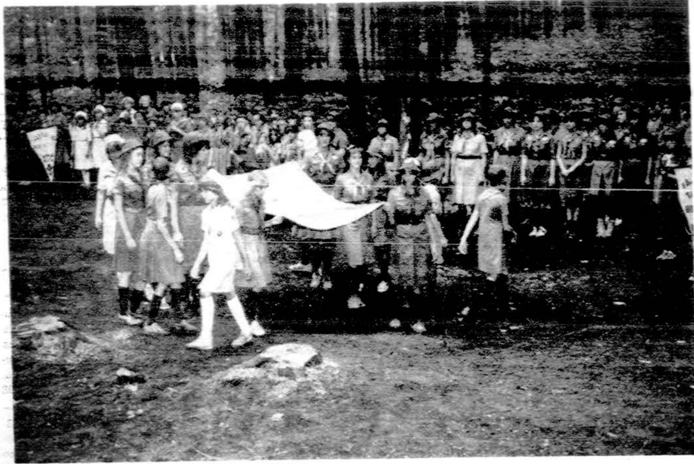
Jubiliejinė stovykla "Aušra". Skautių Seserijos gairė perduodama stovyklai.