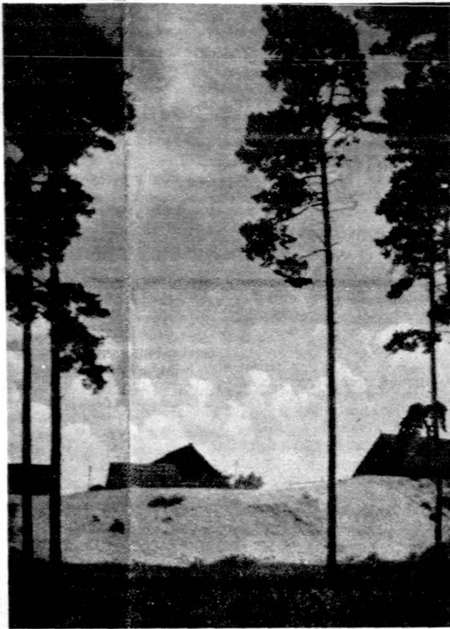
Lietuvškas pajūris. Nerijos kopos priartėja prie sodybų.