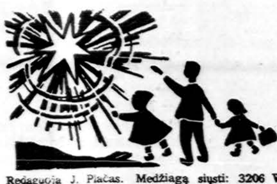
Redaguoja J. Placius. Medžiagą siūsti: 3206 W. 65th Place, Chicago, IL 60629

x "Draugo" administracija po pavykusios pirmos ekskursijos į Egiptą, Izraelį ir Graikiją, kuriai techniškus darbus atliko American Travel Service Bureau atstovs Aleksas Lauraitis, rengia ekskursiją 1984 m. rugpjūčio mėn. Ekskursija bus 18-ka dienų. Aplankys Fatimą, Liurdą, Madridą, Seviliją, Granadą, Parizį ir kitas žymias vietas. Smulkesnė informacija bus skelbiama "Drauge" ir gaunama American Travel Service Bureau. (pr.)