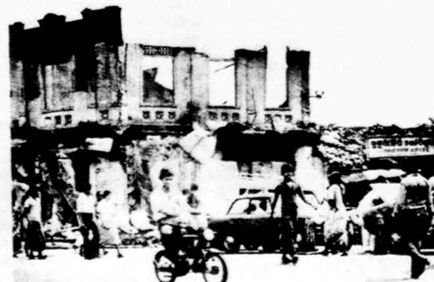
Columbo, Sri Lankos (Ceylono) sostinės apgriauti namai po religinių fanatikų kovų. Kovose užmuštų buvo netoli 300 žmonių.

daugiausia dėmesio. Pagaliau, kur plaukia visos pajamos, gautos už parengtus veikalus? Argi ne į valstybės iždą? Tad kur tų naujų pajamų ieškoti? (Bus daugiau)