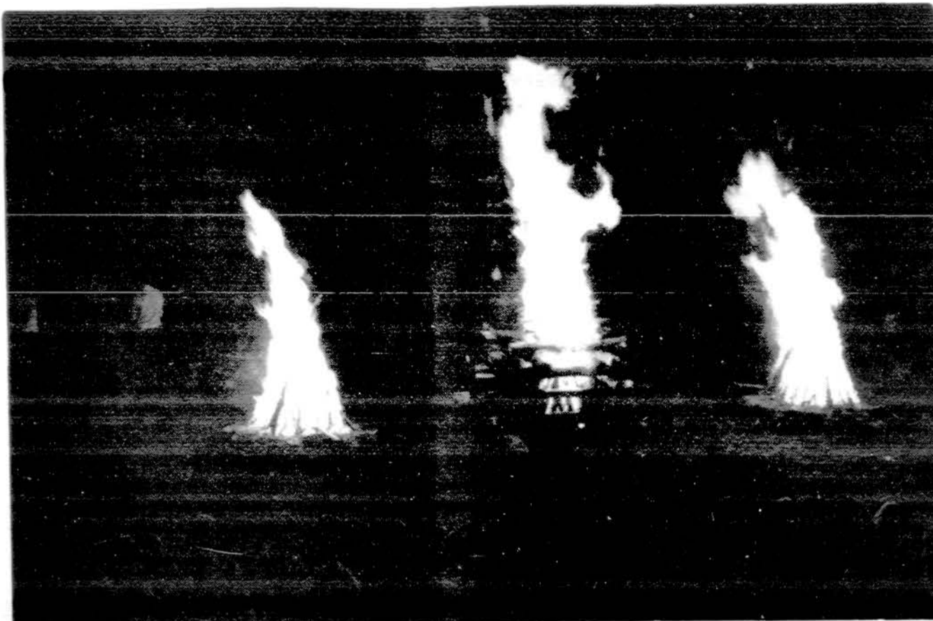
Jubiliejinėje stovykloje liepsnoja laužai, aidai skambi lietuviška daina.