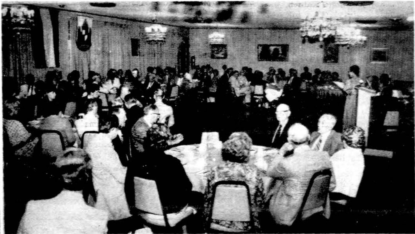
Maž. Lietuvos Rezistencinio sąjūdžio nariai vaka rieniauja Liet. Tautiniuose namuose.