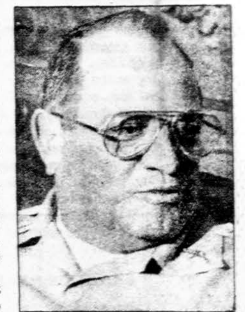
Gen. Oscar Mejia Victores.

Buvęs prezidentas Rios Montt žada iš karšto išvykti. Greičiausiai į Meksiką. Gvatemala yra viena iš septynių Centrinės Amerikos valstybių. Jos plotas lygus Tennessee valstijai. Gyventojų turi 7.3 mil. Kalba ispanų. Raštingų yra tik 47 proc., 90 proc. katalikų.