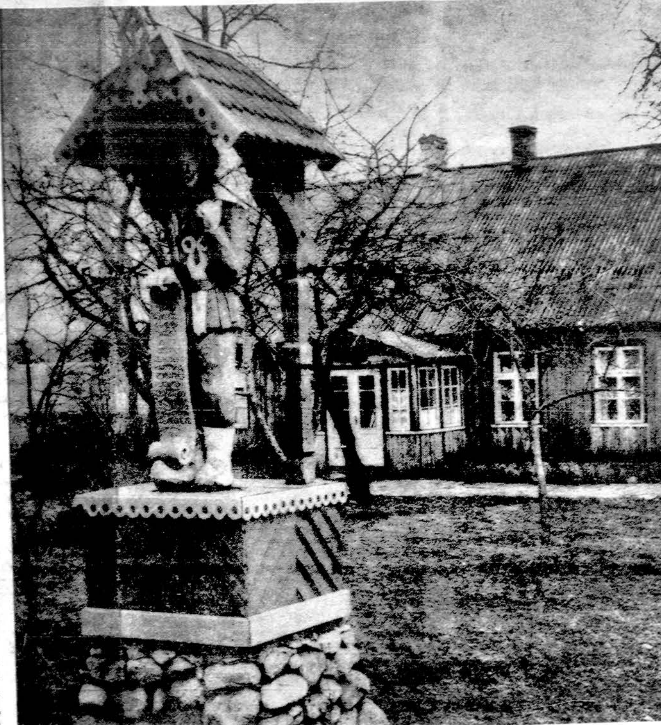
Vysk. Motiejaus Valančiaus gimtinė Nasrėnų k., Salantų parapijoje, Kretingos aps. ir jam pastatytas paminklas, vaizduojąs populiariausią jo literatūrinį personažą — Palangos Južę.