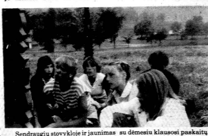
Sendraugių stovykloje ir jaunimas su dėmesiu klausosi paskaitų.