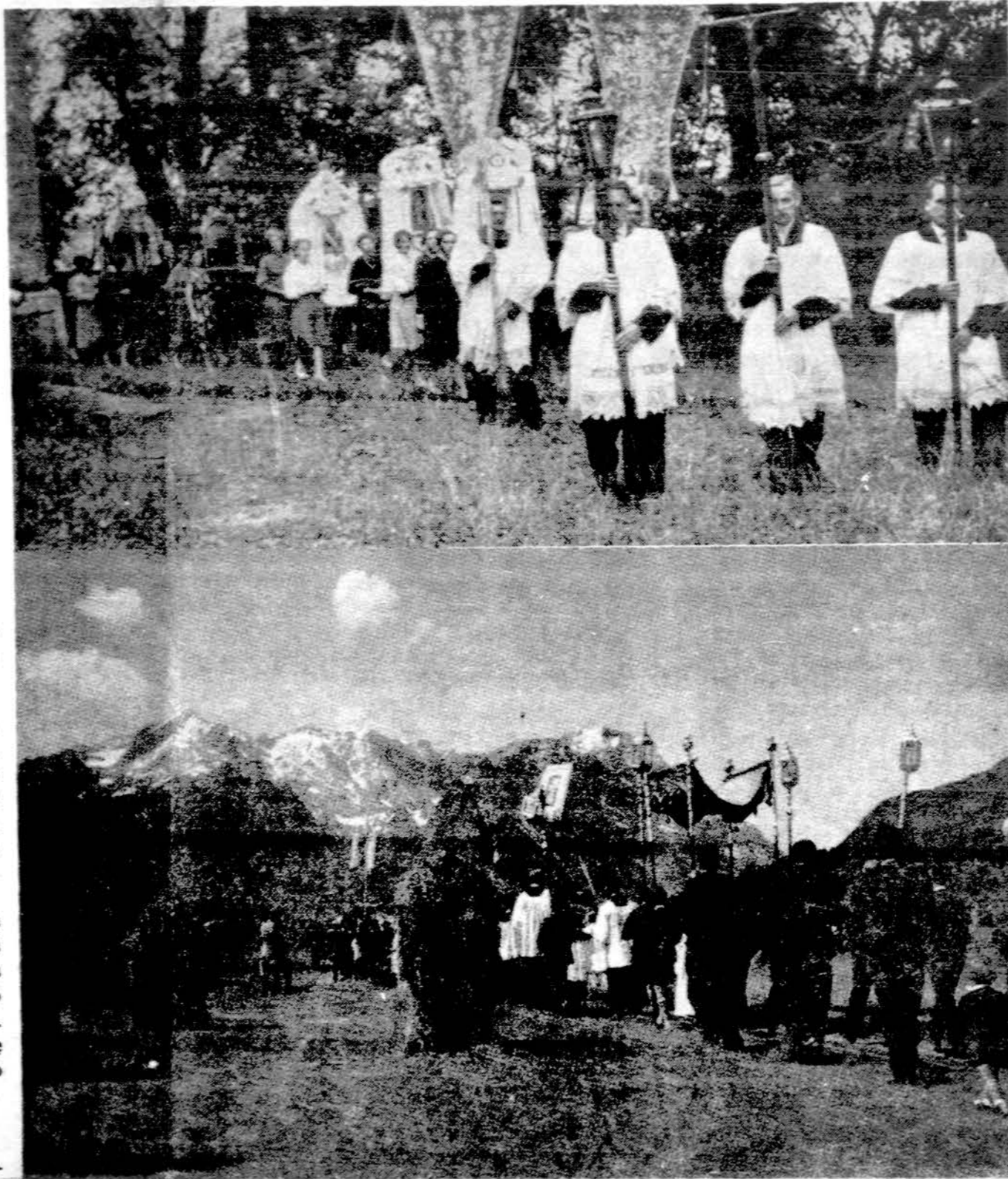
Žolinių šventė nuo amžių Lietuvoje buvo ir yra didelė šventė ir atšvaitai, ruošiamos procesijos, šventinami į bažnyčią sunėsti žolynai. Viršutinė nuotraukoj Žolinių procesija Punske, apačioje — Bavarijoj.

— Amerikos imigracijos ir natūralizacijos įstatiga Miami sulaukė devynis libiečių studentus, kurių vizos pasibaigė ir jie nesirūpino jų pratęsimu.