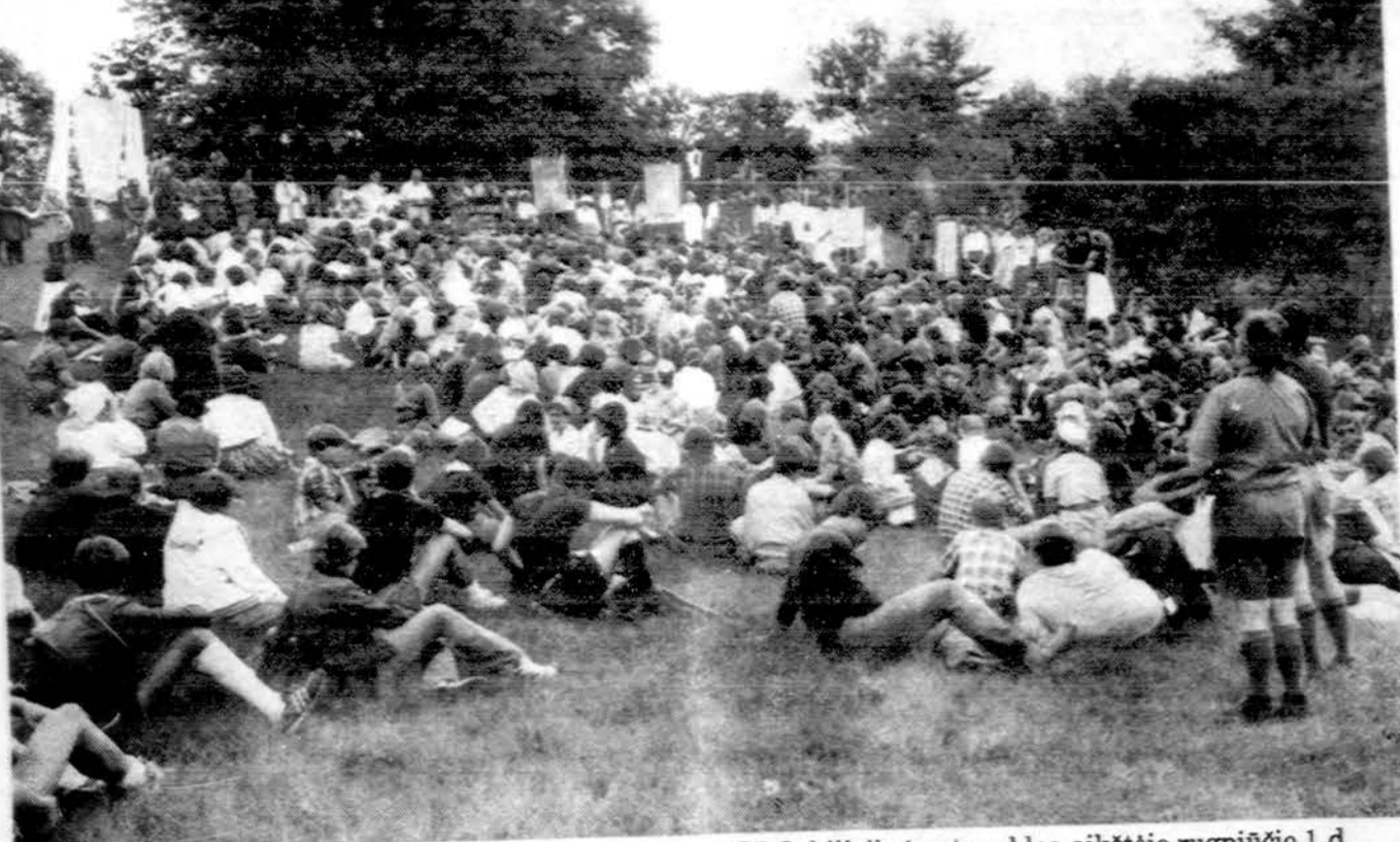
"Aušros" laikotarpio minėjimo dalis šv. Mišiose LSS Jubiliejines stovyklos aikštėje rugpjūčio 1 d.

x ARAS — Dengiame ir taisome visų rūšių stogus. Su aukštu patyrimu; esame apdrausti. Pats prižiūriu darbą. Arvydas Kiela — 737-1717. (sk.)