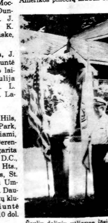
Šaulių dainių vėliavos išsirikjavusios pamaldų metu.

Melrose Parko Lietuvių Amerikos piliečių klubas savo