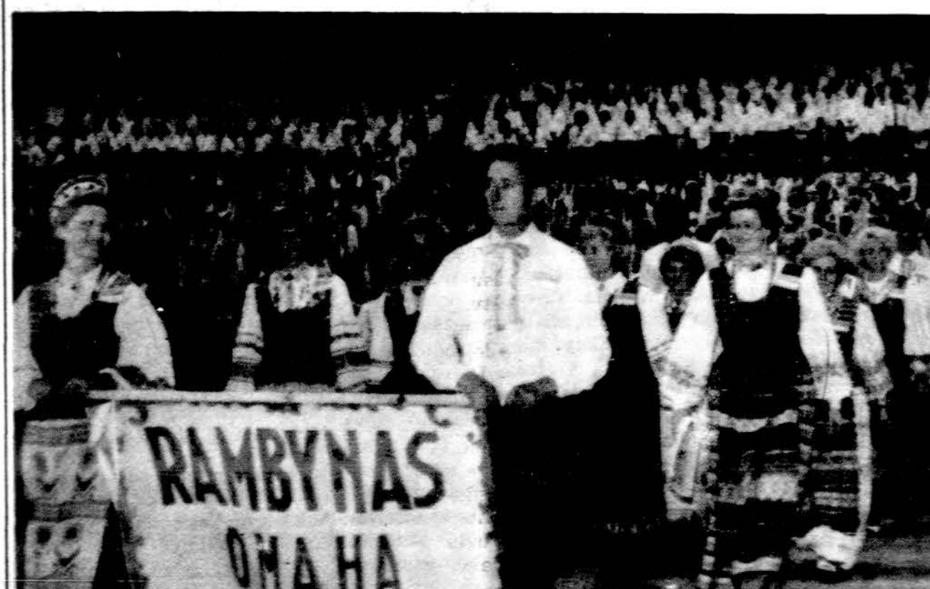
Omahos dainininkai Dainų šventėje.