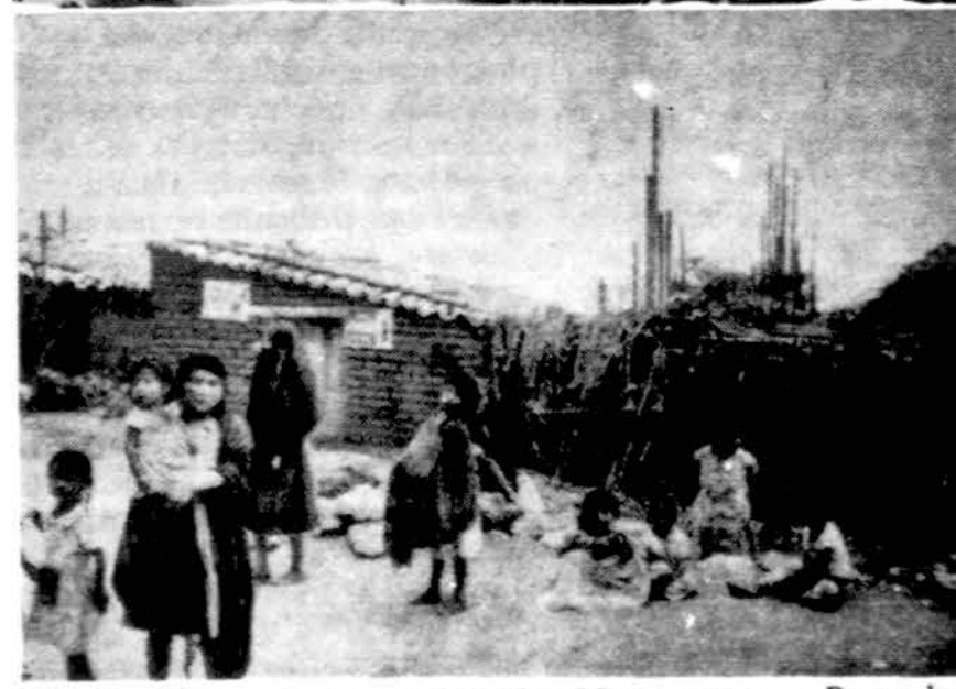
Meksikos kontrastai. Viršuje Meksikos Miesto centras — Paseo de la Reforma gatvė; apačioje San Lorenzo miesto pakraštis vargingųjų lušnos.