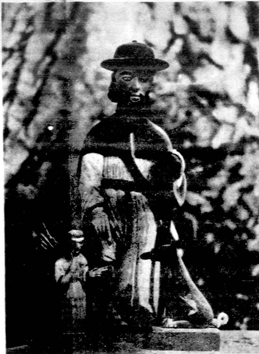
Sventasis Rokas. Nežinomo lietuvių liaudies menininko darbas, nežinoma ir vietovė. Sv. Rokas lietuvių liaudies mene vaizduojamas dažnai su Gotardo šuniu, kuris laiko dantyse duonos gabalą. Šuo, sakoma, kasdien atnešdavo duonos, kai Rokas buvo Piacenzos miške, Italijoje.

Štai anekdotiškas nuotykis. Vienos mažesnės įstaigos dirbantiesiems buvęs skirtas tik vienas talonas. Nežinodamas, kam jį skirti, įstaigos viršininkas pasiėmęs „saliarmoniška“ nupirkęs tuos talonus priklausiusius skudurus,