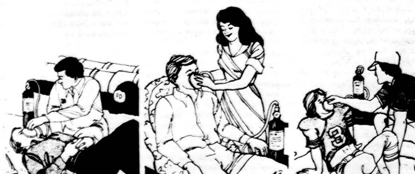
Maske ant veido uždėjus, deguonis duodamas darbe, namuose bei sporto aikštėje. Nešiojamas deguonio butelis sveria tris svarus. Modelis No. 31-01-0500 įsigijamas už apie 65 dolerius: Lif-O-Gen Division. 1720 Sublette Ave. St. Louis, MO 63110, o taip pat ir Sodyboje.