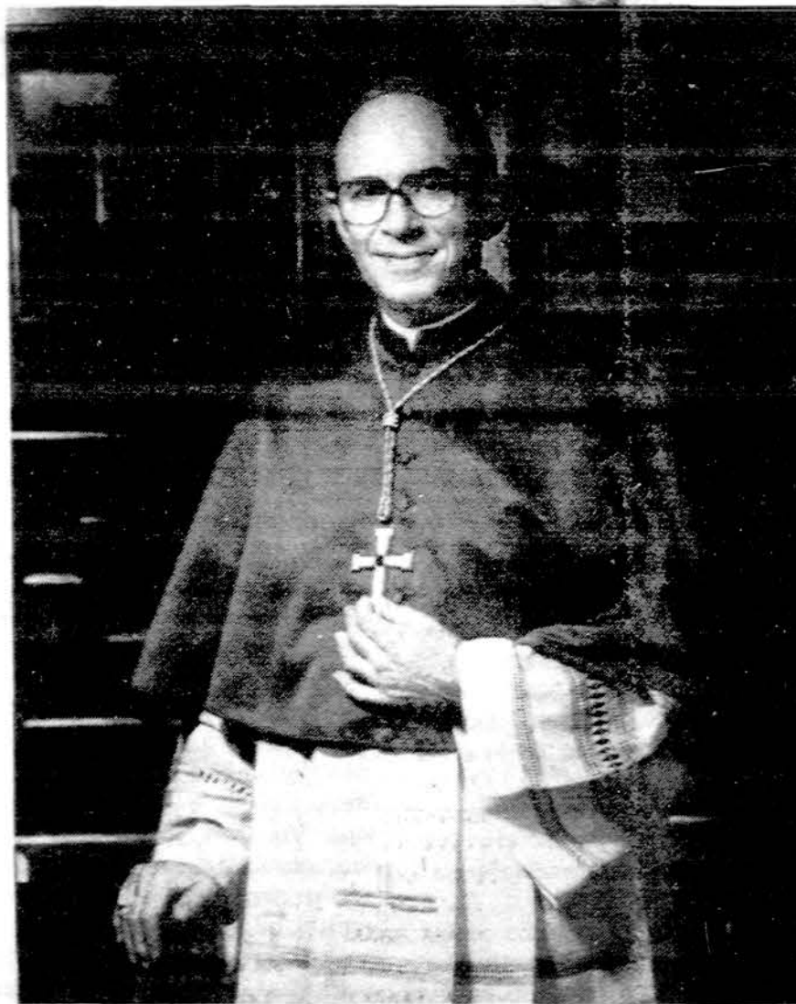
Šią savaitę Chicago katalikų parapijos mini pirmąsias naujojo arkivyskupo J. Bernardino metines. Stebėtojai palankiai vertina naujojo arkivyskupo veiklą. Didžiausias jam metamas priekaištas, kad jis neleidžia mergaitėms patarnauti Mišių metu prie altoriaus.

— Prancūzų Cannes mieste plėšikai išnešė iš brangenybių parduotuvės 5 mil. dol. vertės brangakmenių ir papuošalų.