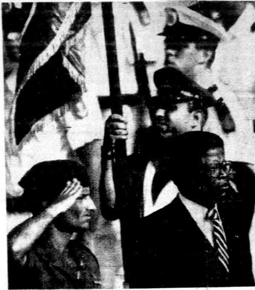
Liberijos prezidentas gen. Samuel Doe atvyko į Izraelį. Jis generolu tapo neseniai. Prieš perversmą jis buvo Liberijos kariuomenės viršila. Liberija nutarė atgaivinti diplomatinius ryšius su Izraeliu, kuris plečia savo įtaką Afrikos juodųjų valstybėse. Liberijos prezidentas yra pirmas Afrikos vadai, aplankęs Izraelį per paskutinius 12 metų. Ateityje laukia ma daugiau Afrikos svečių.

Washingtonas. — Amerikos „Pershing 2“ raketos turi būti išdėstytos Vakarų Vokietijos bazėse jau gruodžio mėnesį, tačiau iki šiol nebaigti jų raketų bandymai. Pentagonas paskelbė, kad šią savaitę numatytas bandymas atidedamas iki rugsėjo mėnesio. Per praėjusius 16 bandymų tu kartus raketa išsprogė, du kartus nulėkė į šalį, vieną kartą nukrito toli nuo taikinio. Armijos žiniomis, rašo „Washington Post“, raketa siunčiama jos gamintojams Martin-Marietta Co. tyrimams rentgeno spinduliais. Raketos bandymai turėjo būti užbaigti jau gegužės mėnesį.