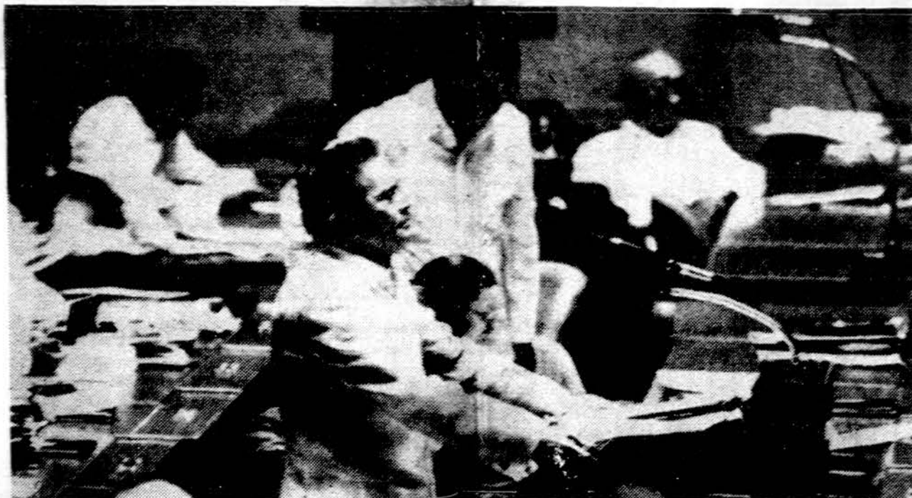
Filipinų opozicijos vadas Salvador Laurel pasakė kalbą šalies nacionalinėje asamblėjoje. Jis klausė, kaip galėjo senatorius Aquino žudikas prieti su dideliu revolveriu prie stipriai saugomo lėktuvo? Kaip jis žinojo, kur laukti atvykstančio senatoriaus? Kodėl žudikas buvo tuoj nušautas? Kodėl iki šiol niekas nežino, kas tas žudikas, kas jo vadai? Nužudytas senatorius laidojamas sekmadienį. Policija laukia neramumų ir protestų.

— Mozambikos valstybėje dešinieji sukilėliai puolė brangakmenių kasyklų rajoną prie Morrua miesto. Daug civilių ir kareivių žuvo kovose. Sukilėliai nušovė du rusus ir 24 paėmė į nelaisvę. Kasyklose dirbo nemažai socialistinių šalių geologų, paskelbė portugalų radijas.