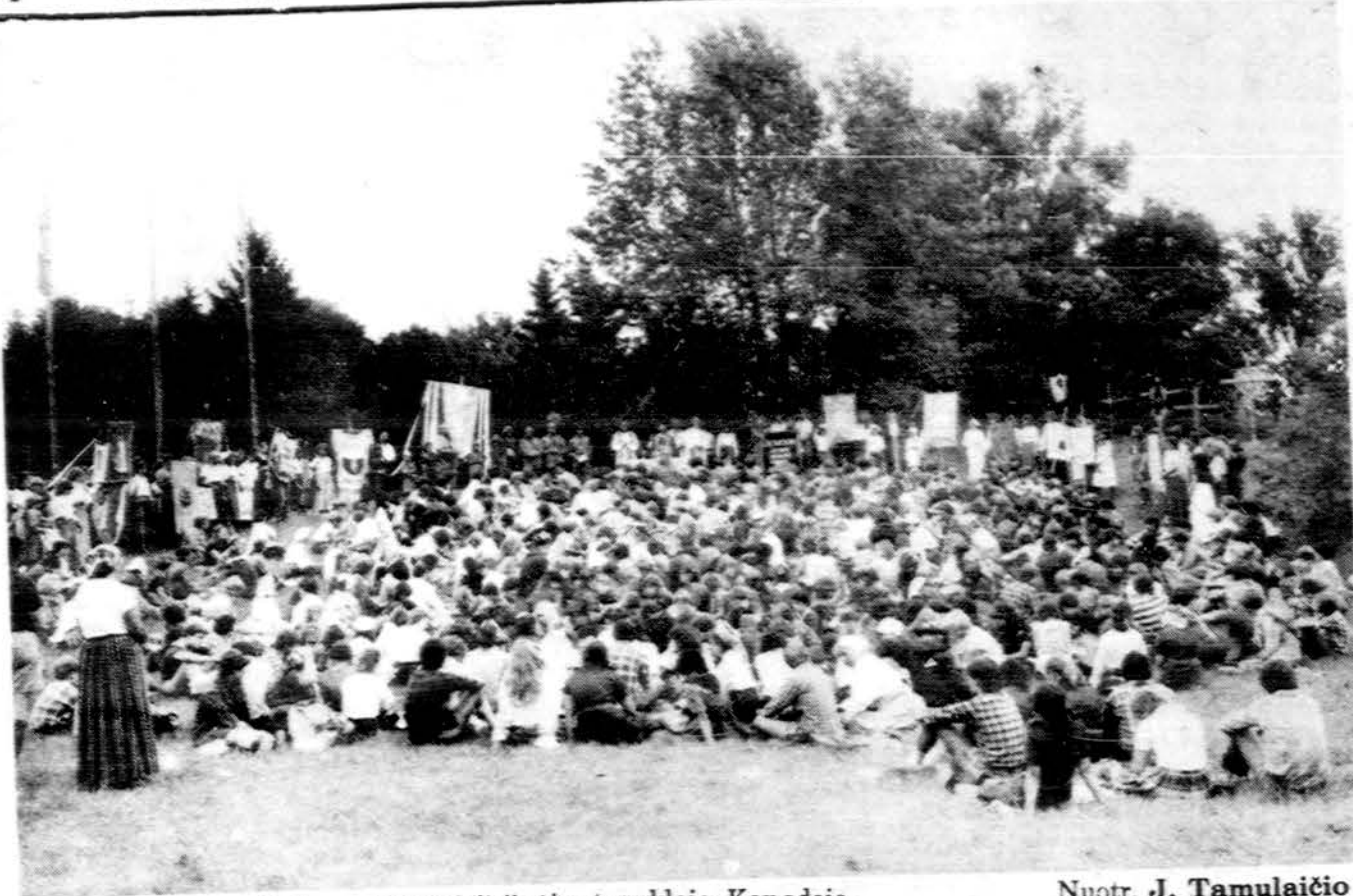
Pamaldos "Aušros" dienos LSS Jubiliejinėje stovykloje, Kanadoje.