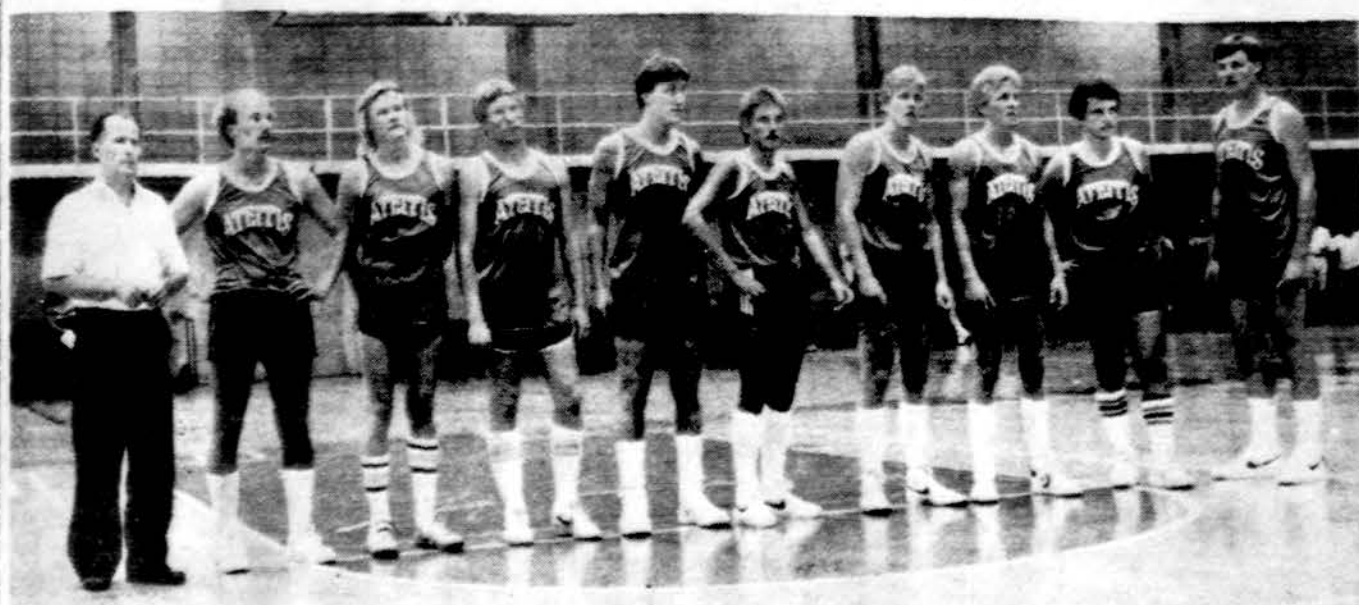
Cicero "Ateities" vyrų krepšinio komanda prieš rungtynes su Australijos lietuvių rinktinė Illinois universiteto sporto salėje. Kairėje — vadovas E. Sulaitis, antras iš dešinės — kapitonas E. Sulaitis.