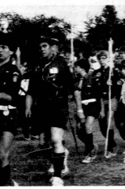
Oro skautai Jubiliejinės stovyklos parode.

Iš patyrimo žinome, kad gerai atlikti L. Skautybės fondo atstovo pareigas nėra lengvas uždavinys. Dėl to jau kevienu vietovė turi visą būrį talkininkų, kurie gelbsti atstovams. Tokiu būdu lėšų telkimo darbas pasidaro ne tik lengvesnis, bet ir našesnis. Turint didesnę skaičių pagelbininkų, neunku surengti ir koncertai, ar šiaip kokį kultūrinį renginį fondo naudai. Jau kaikiuros vietovės bando savo jėgas gana sėkmingai. Po aštuonerių