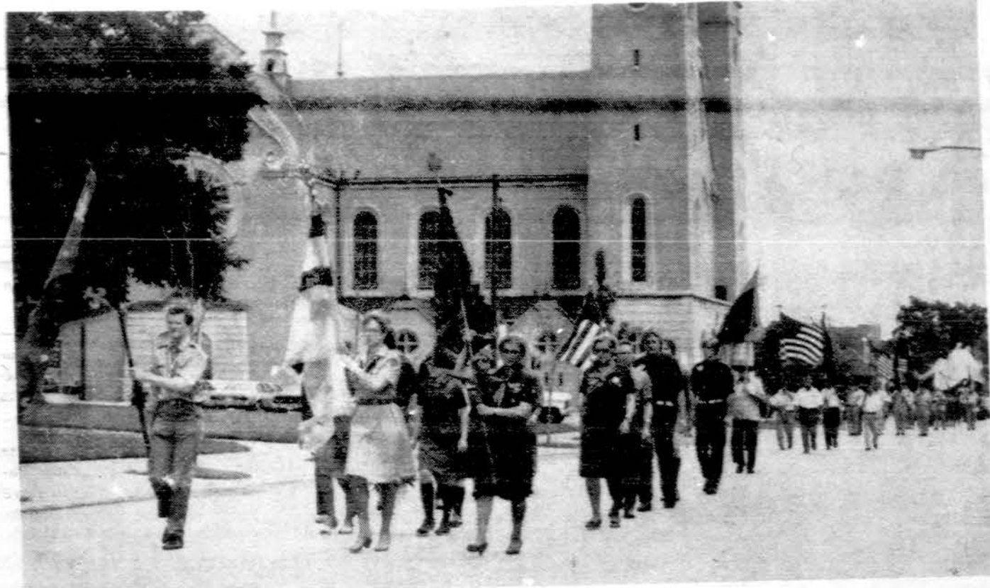
Skautiškų vienetų vėliavos didžiajame Dariaus ir Girėno tragiškojo transatlantinio skrydžio 50 metų sukakties minėjimo parade, Chicagoje.