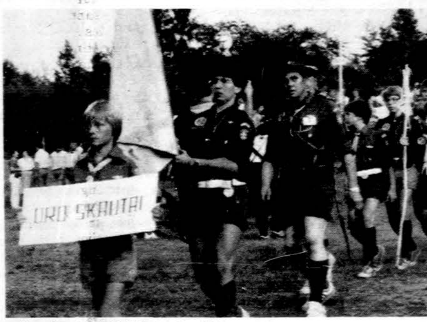
Oro skautai Jubiliejinės stovyklos parode.