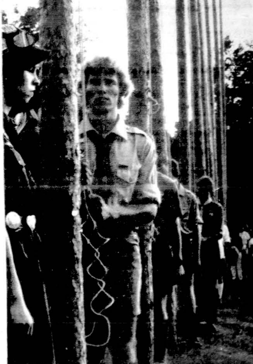
Vėliavininkai pasiruošę vėliavų nuleidimui