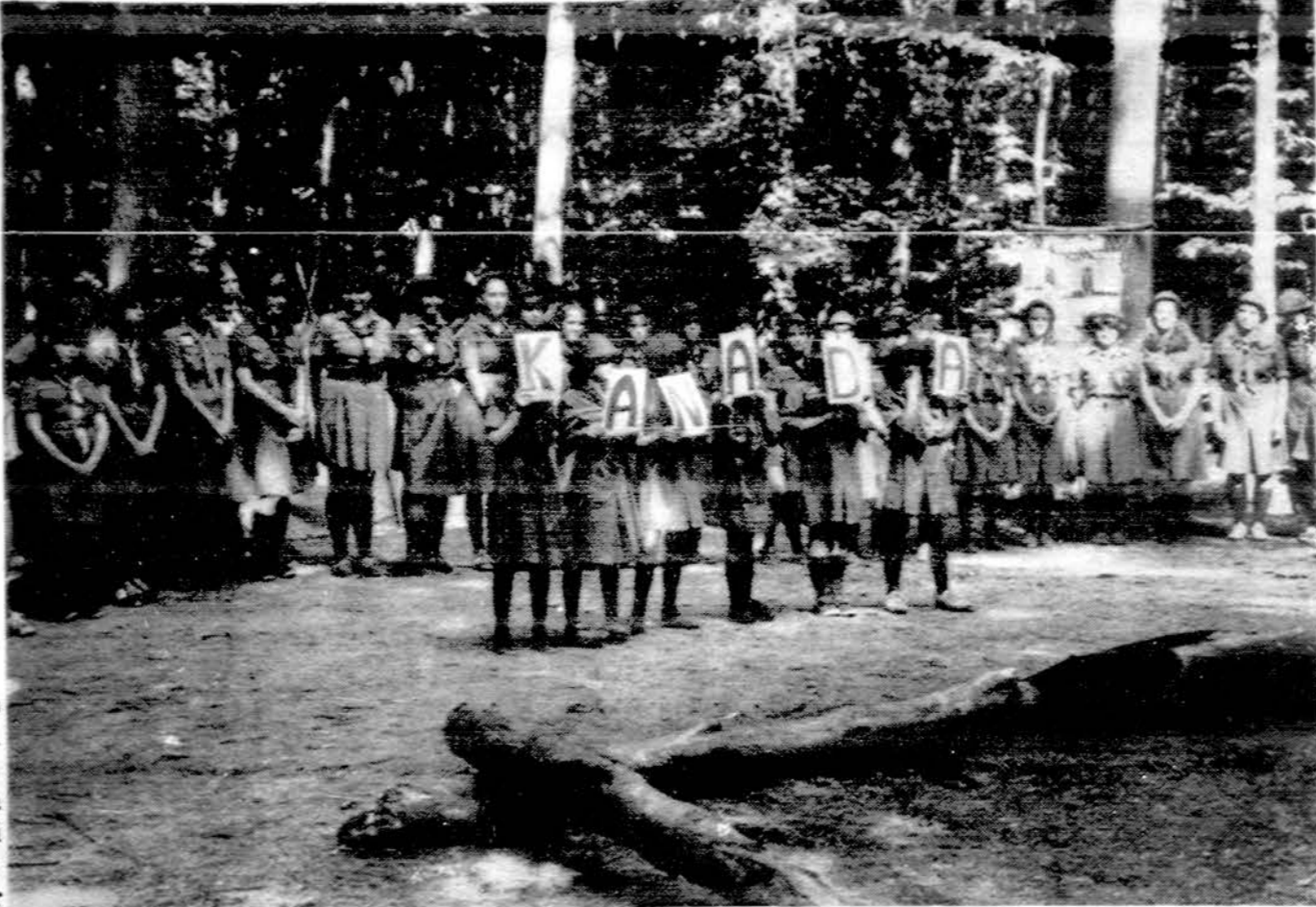
Dalis Kanados rajono sesių.

Gražus Kanados rajonas, pasipuošęs joms būdingais