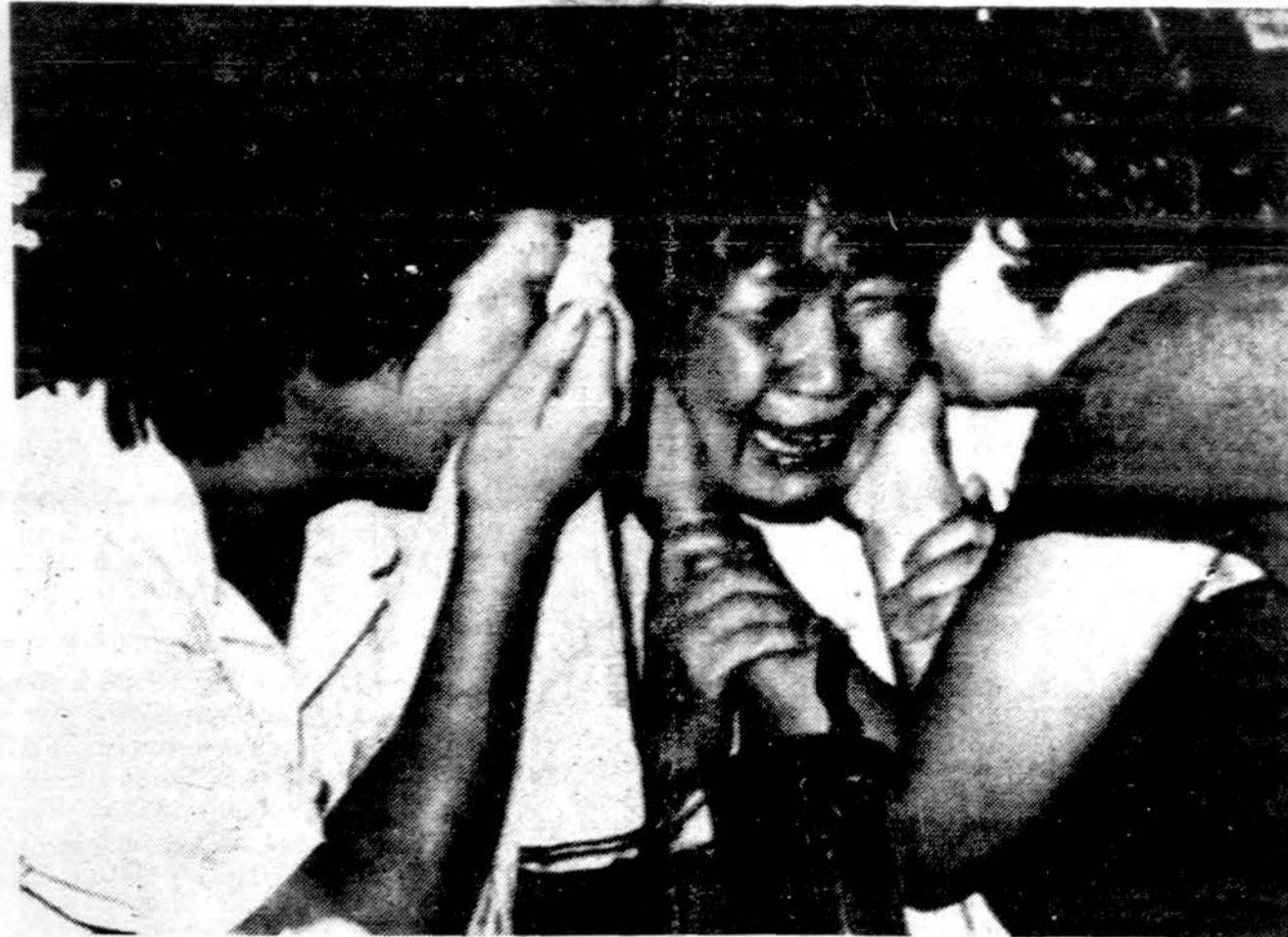
Pietų Korėjoje gimines su sąsaramis sutiko žinia, kad keleivinis lėktuvas nukrito į jūrą. Sovietų karo lėktuvai numušė keleivinį Pietų Korėjos lėktuvą, skridusį iš New Yorko per Anchorage į Seulą su 269 žmonėmis.