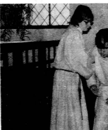
Vasario 16 gimnazijoje Vysk. M. Valančiaus moksleivių ateitininkų kuopos nariai vaidina Kristaus suėmimą.

trumpus vaidinimus, kuriuose jaunieji vadovai sugebėjo išlaikyti pagrindinę savo pavelislo mintį — krikščionybės skelbimas, pagarba kultūrai, tikėjimas persekiojimo metu, bendruomeninių papročių svarba krikščionybei ir asmeniškai Kristaus pažinimas. Kadangi keliuose skaityta tiesiai iš šv. Rašto, pabrėžta ir N. Įstatymo svarba. Gal įspūdingiausia buvo valandėlė, kai salėje sėdintys stovyklautojai laikė žvakes, o Vidai išsukaus