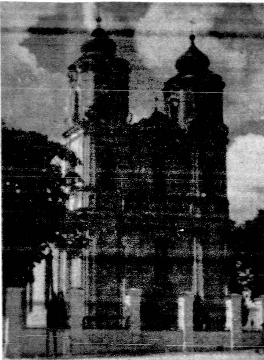
Seinų katedra — bazilika. Seinų bažnyčiai buvo lemta likti vyskupijos katedra, kai 1818 m. vyskupijos centras iš Vygrių buvo perkeltas į Seinus.

× 1983 metų kelionės — Dvieju savaičių ekskursija: Maskva, Vilnius, Ryga, Maskva. Spalio 2 d. Kainos iš Bostono — New Yorko — 1,285 dol. — 1,355 dol. Iš Chicago — 1,450 dol. — 1,520 dol. Dvieju savaičių Lietuvos ekskursijai gali susidaryti galimybė pratęsti viešnagę Vilniuje. Tarpininkaujam norintiesiems užsakyti automobilius giminėms Lietuvoje. Kreipitis į lietuvišką kelionių agentūrą: American Travel Service Bureau, 9727 So. Western Ave., Chicago, Illinois 60643. Tel. 312 — 238-9787. (sk.).