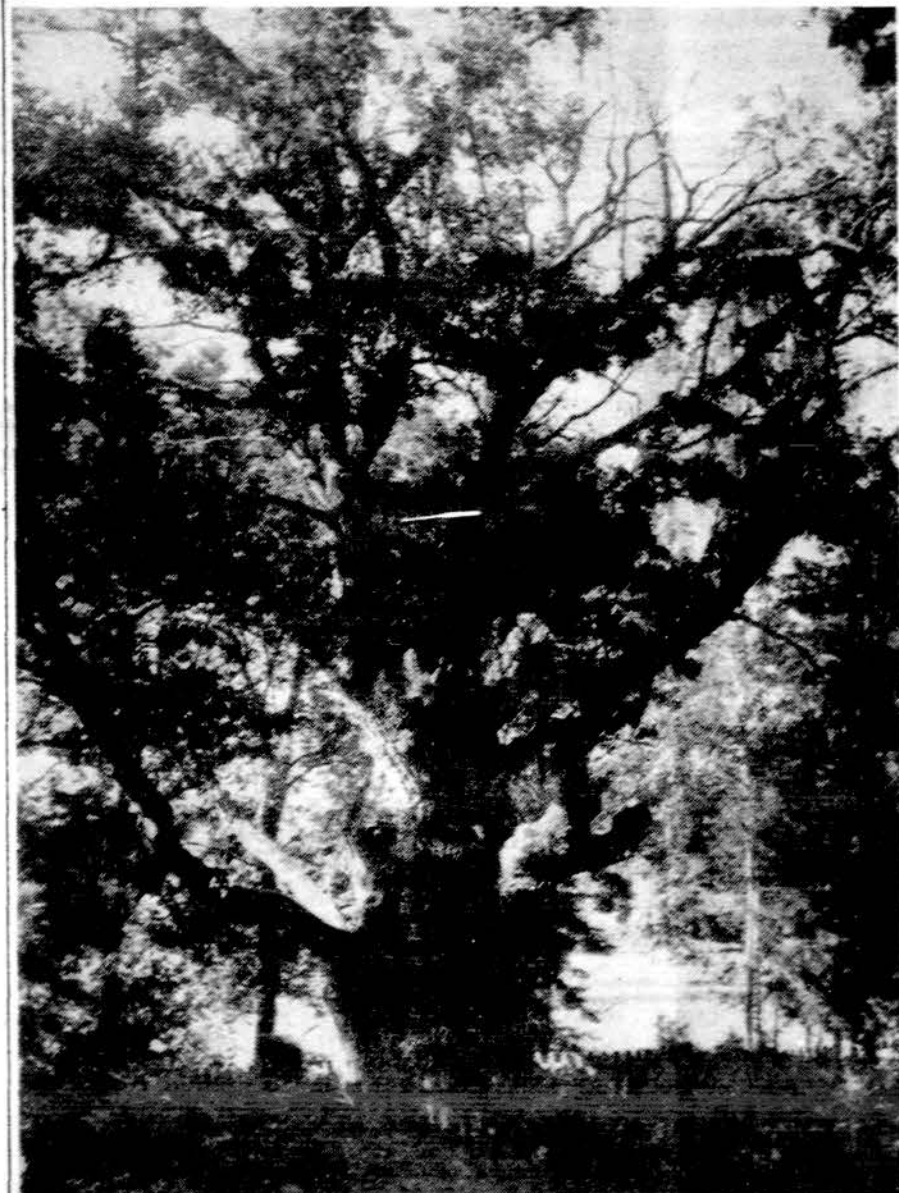
Storiausias ir turbūt seniausias, 2000 metų Lietuvos ažuolas — Stelmuzėj, netoli Zarasų.