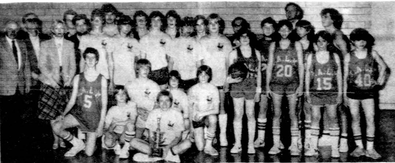
ČALM, Dariaus-Girėno ir Kr. Donelaičio lit. mokyklų krepšininkai.