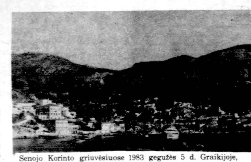
Senojo Korinto griuvėsiuose 1983 gegužės 5 d. Graikijoje, "Draugo" ekskursijos dalyviai.

Iš kolchozo persikelti į kitą gyvenimo pusę, būtent fil mus ir televiziją. Mannheimo dienraščio "Mannheimer Mor gen" Maskvos koresponden-