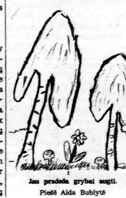
Jau pradeda grybai augti.

Gyveno močiutė, vardu Julija. Ji buvo labai sena, jos nosis buvo didelė ir jos veidas labai raukšlėtas. Ji turėjo tik kelis plaukus ant savo galvos. Močiutė turėjo mažą anūkėlę Ligiją. Ligija jai sakė: "Močiute, mieste yra tokia Raganų krautuvė, kur galima pirkti "Močiucių formulą", ir tu pasi-darysi jauna.