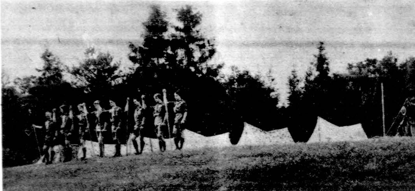
"Miško broliai" Jubiliejinės stovyklos sargyboje

Suvažiuoti iš labai tolimų kraštų, kaip pvz., Australijos, Europos, P. Amerikos ar iš