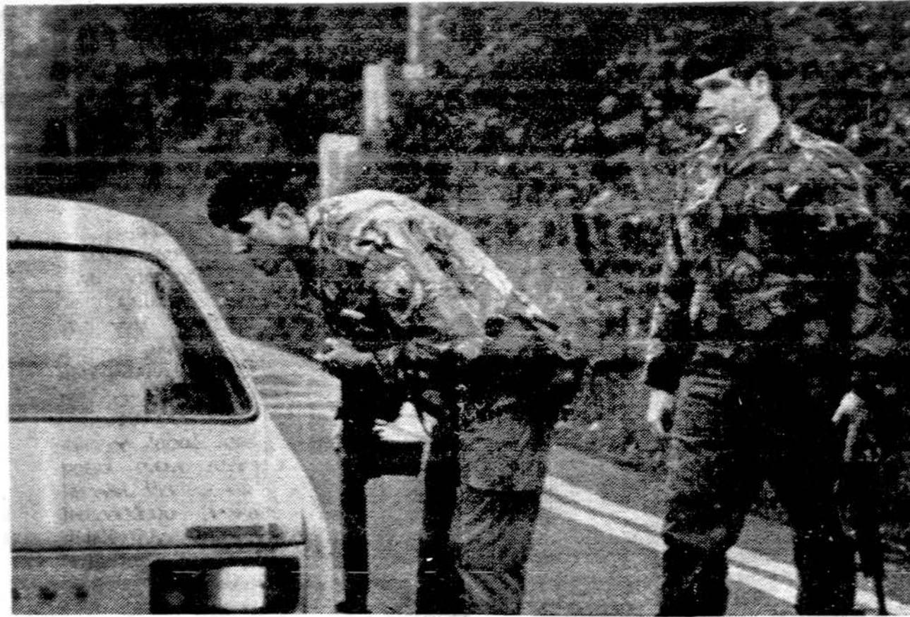
Siaurinėj Airijoje kareiviai tikrina visus automobilius, ieškodami iš kalėjimo pabėgusių teroristų. Belfasto kalėjimas buvo laikomas labai saugiu, tačiau arių respublikos armijos dalyviai apsi-

— Nuo vežio ligos mirė Ruth Carter Stapleton, 54 m., buvusio prezidento Carterio jaunesnė sesuo.